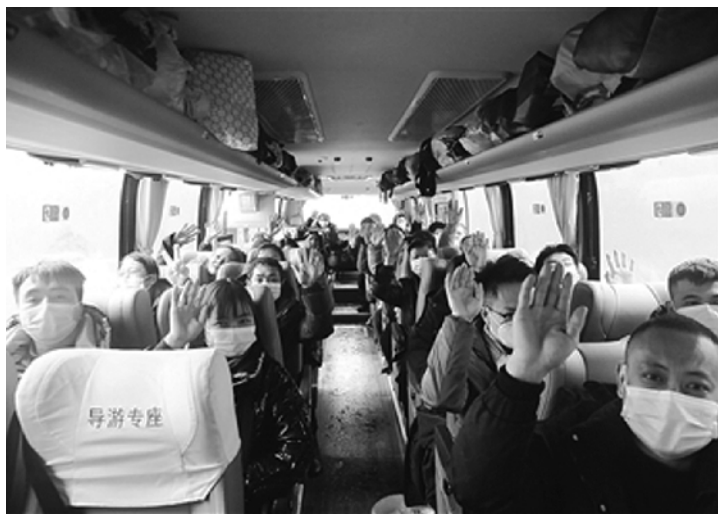
供暖心服务的企业值得肯定和点赞。此举不仅有助于职工平安回家,还有助于引导他们在节后以