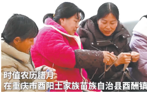
时值农历腊月，在重庆市酉阳土家族苗族自治县酉酬镇