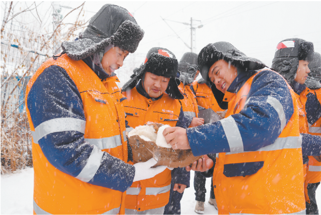
中铁电气化局集团沈阳电气化工程分公司的工会干部为一线职工送上防寒物资