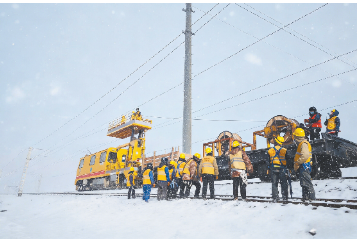
职工在哈大线大修工程现场进行接触网架设作业