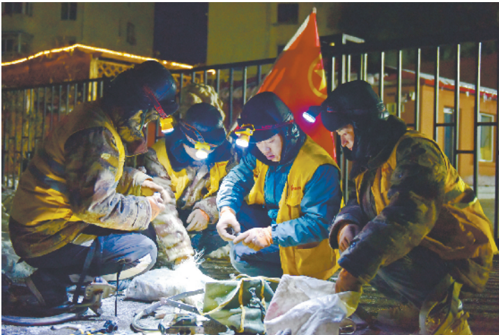
施工人员在哈大线大修工程封锁点前做准备工作