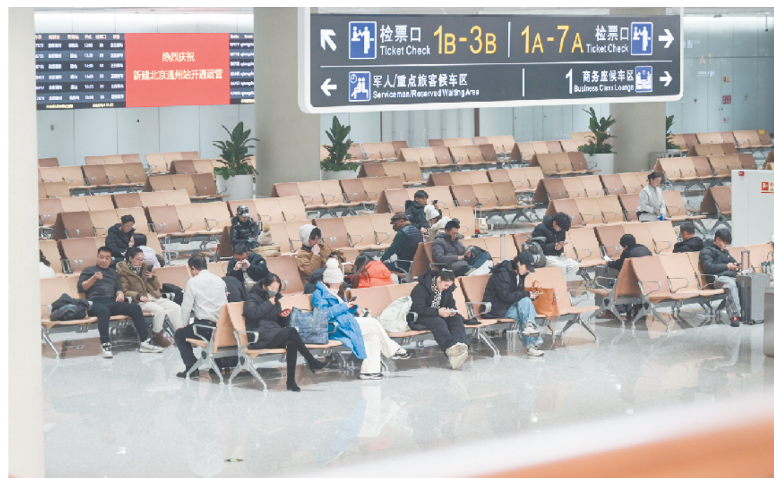
北京通州站内，旅客在座椅区休息等候

现代化的车站，快捷、舒适的旅途，京津冀“一小时交通圈”再提速……近日，随着北京通州站投入运营，北京迎来“八站两场”枢纽新格局，特别是北京通州站开通后，不仅通过京唐、京滨城际铁路衔接，可快速串联天津、唐山、秦皇岛等京津冀重要城市，也让家住河北燕郊、大厂的跨省通勤族出行有了便捷的新选择。近日，本报记者实地乘车体验，感受京津冀通勤的舒适便捷。