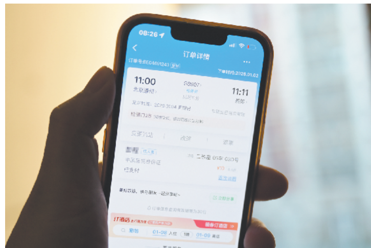
本报记者乘车体验“轨道上的京津冀”提速升级