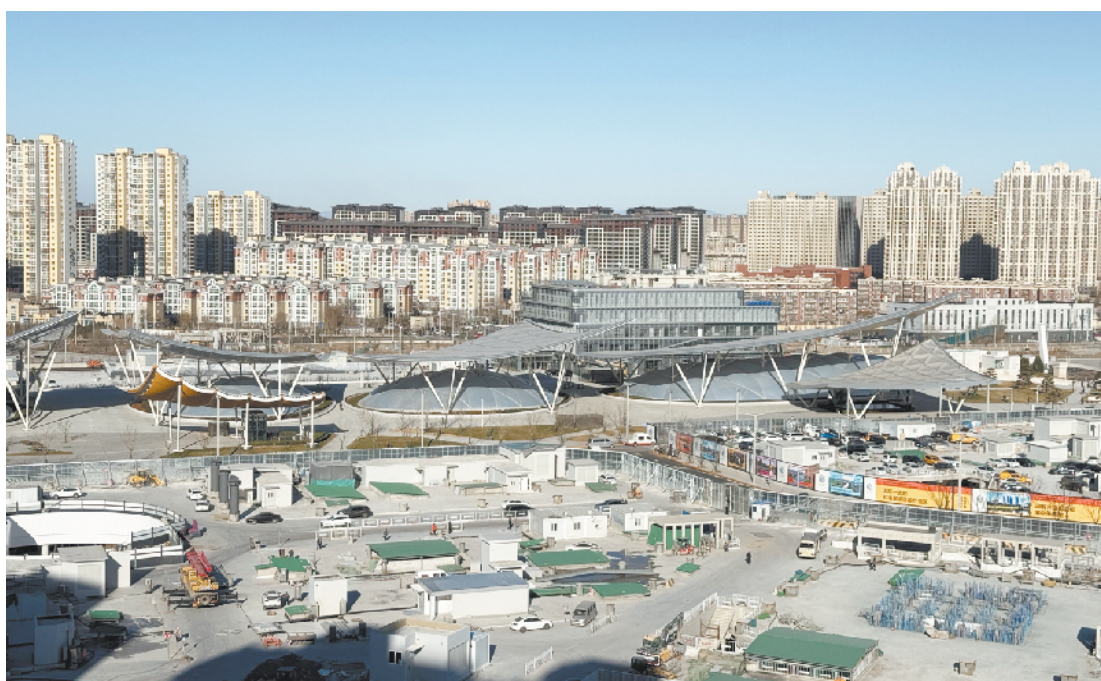
俯瞰北京城市副中心综合交通枢纽