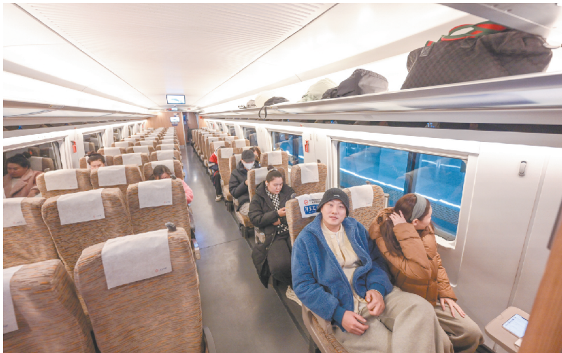
车厢内干净整洁、座椅舒适