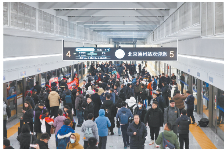
铁路站台安装了“全包裹”屏蔽门