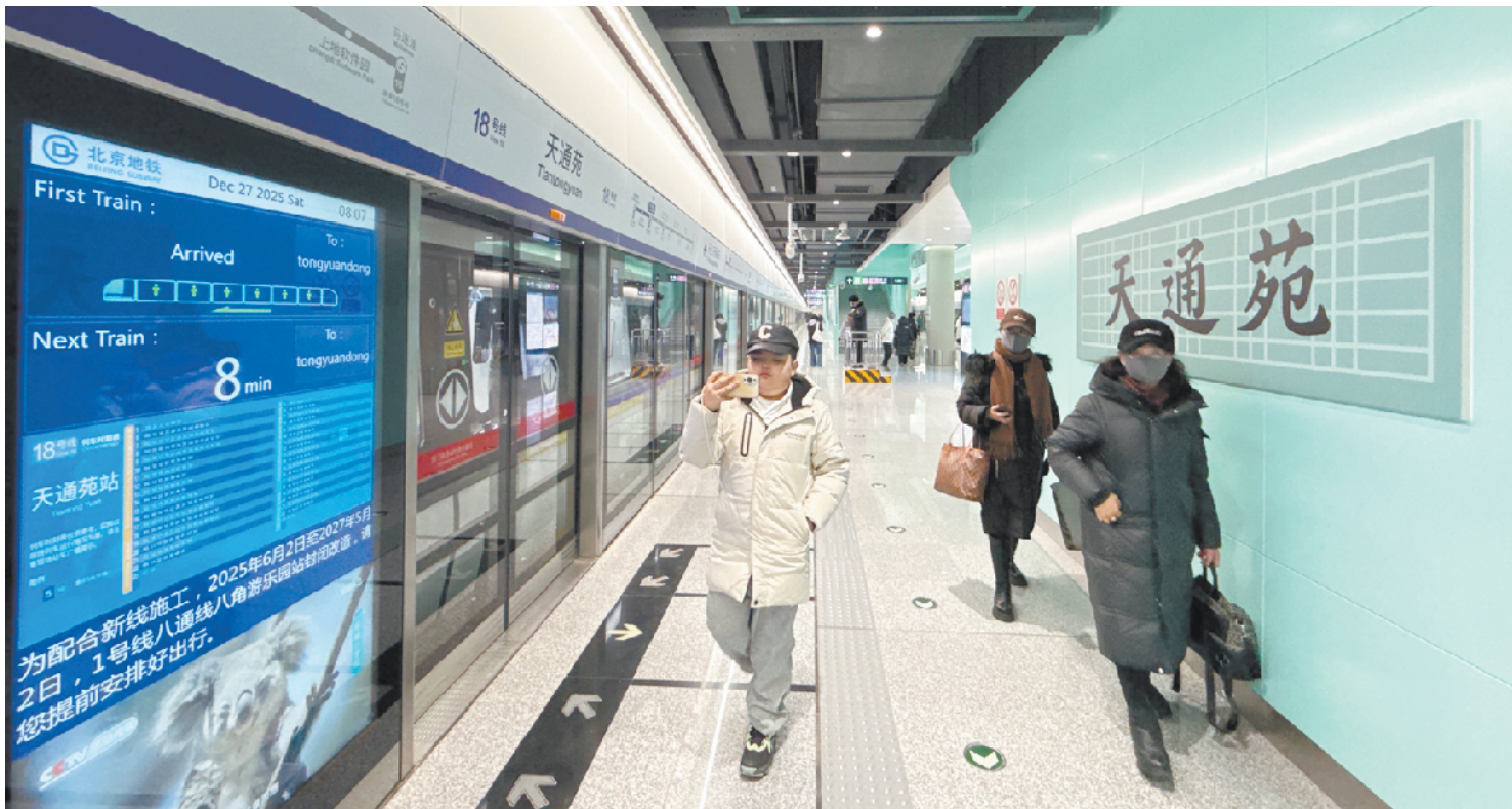
18号线站台门旁的综合信息显示屏，各种车辆动态信息一目了然

三条新线的开通，为岁末迎新的市民出行提供了极大便利。17号线中段串联起工人体育场