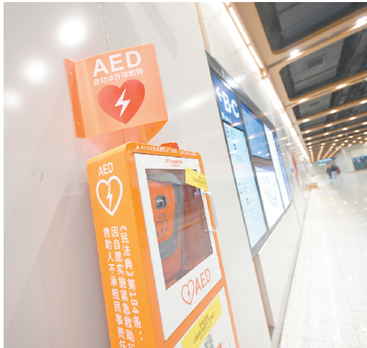
站内配备AED急救设备