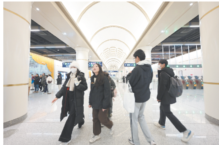
17号线永安里站内，新中式风格与西式对称美学巧妙融合