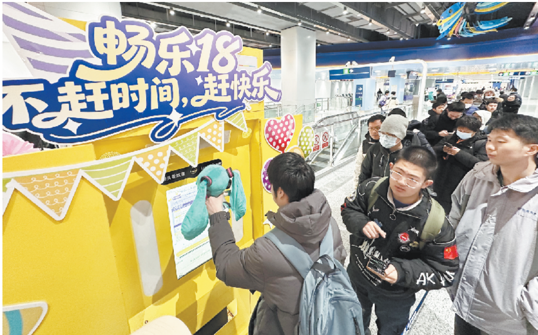
18号线开展地铁车迷集章打卡活动

（馆），市民可直达观看赛事；18号线实现“回天地区”30分钟直达海淀核心区；6号线南延则搭建起城市副中心的“便捷纽带”，方便市民游客深度体验城市副中心的崭新风貌与文化魅力。