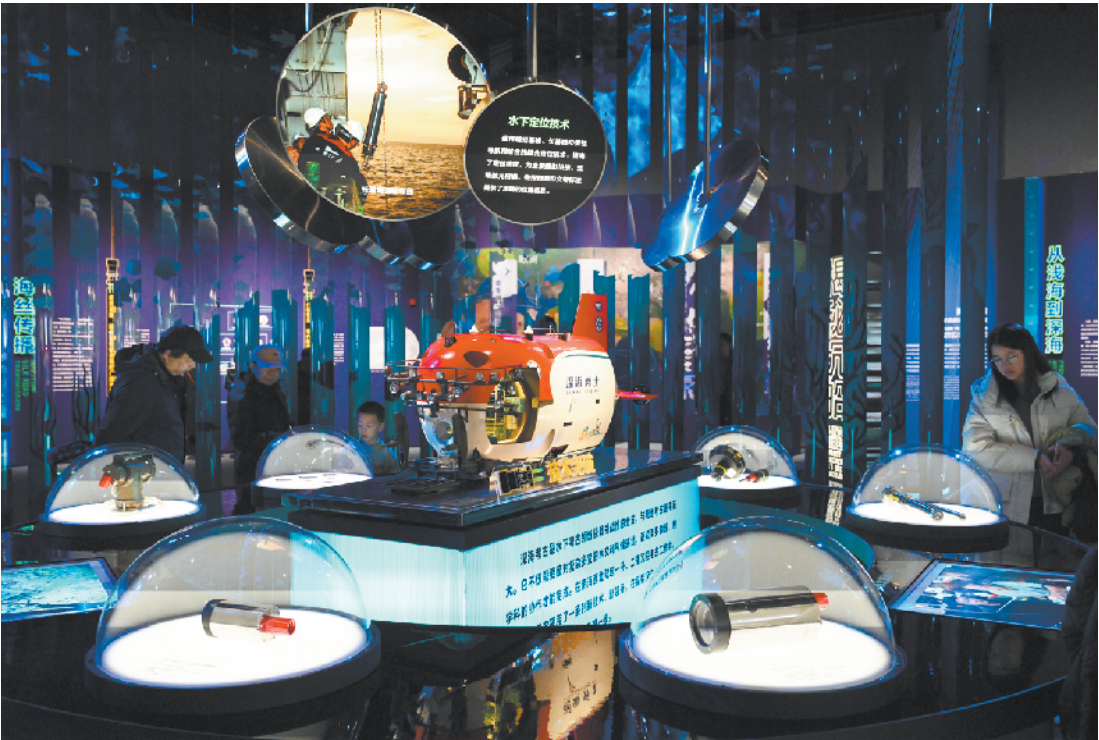
“深海勇士”号载人潜水器模型亮相展厅，向观众展现我国在深海考古领域的科技智慧