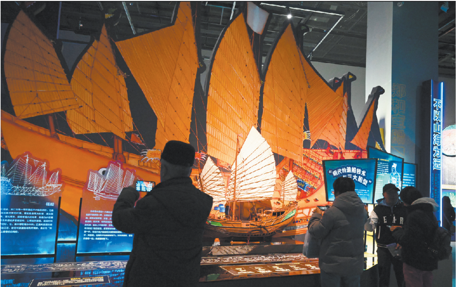
近日，“向海而行——中国南海西北陆坡海域深海考古特展”在北京大运河博物馆开展

“满满的科技感”，这是本次特展的一大特色。展览设置了科技展区，陈列“深海勇士”号载人潜水器模型、深海照明灯等设备，还通过模拟实验室展示文物脱盐、除锈等保护流程。此外，展览也间接呈现了诸多深海考古技术，让观众清晰看到深海科技与考古工作的跨界融合成果。该展览将展出至2026年3月15日，观众可以免费参观。