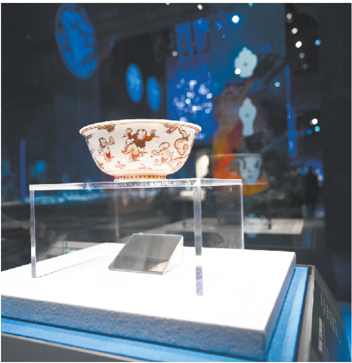
带有“丙寅年造”字样的红绿彩碗帮助专家准确锁定了沉船的年代