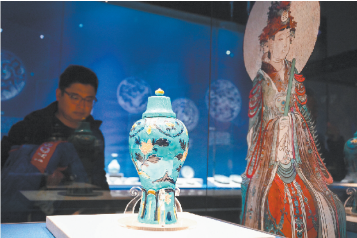
观众驻足欣赏珐华孔雀绿釉寿石牡丹纹带盖梅瓶