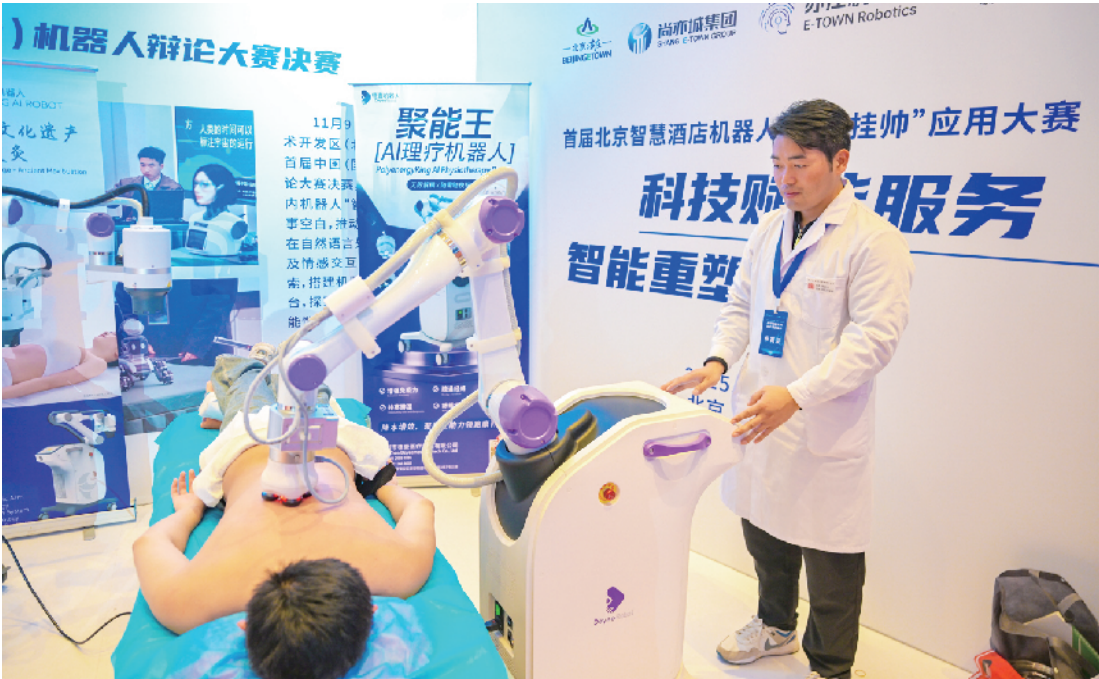
AI按摩理疗机器人进行展示