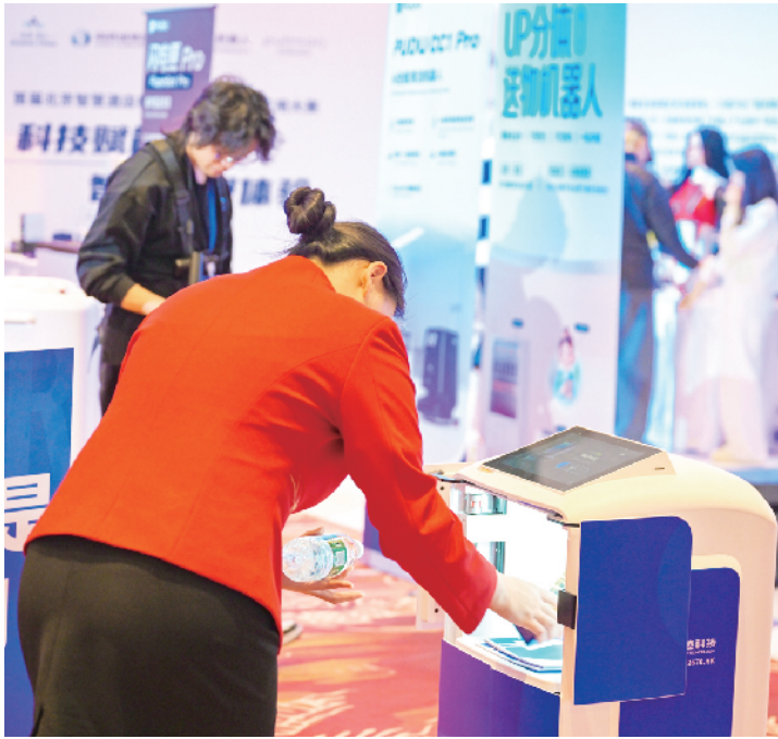
UP机器人展示购物和送货