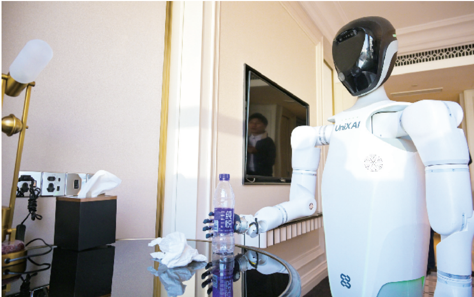
客房服务机器人进行垃圾回收展示

从大堂乘电梯到6楼客房，有机器人在运送指定物品；在3层大厅，迎宾引导机器人通过语音或屏幕互动带来流畅服务；客房或公共区域内，客房服务机器人在执行清洁消毒任务；在酒店指定区域，还有各种机器人在做体检、摊煎饼、沏茶……近日，北京兴基铂尔曼酒店内，各类酒店机器人忙得不亦乐乎。原来，全国首个基于真实场景和实际需求的酒店机器人应用大赛在这里举行。