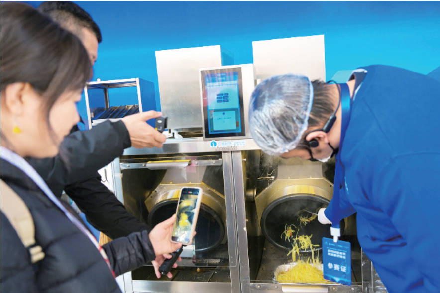
厨房服务机器人展示炒菜