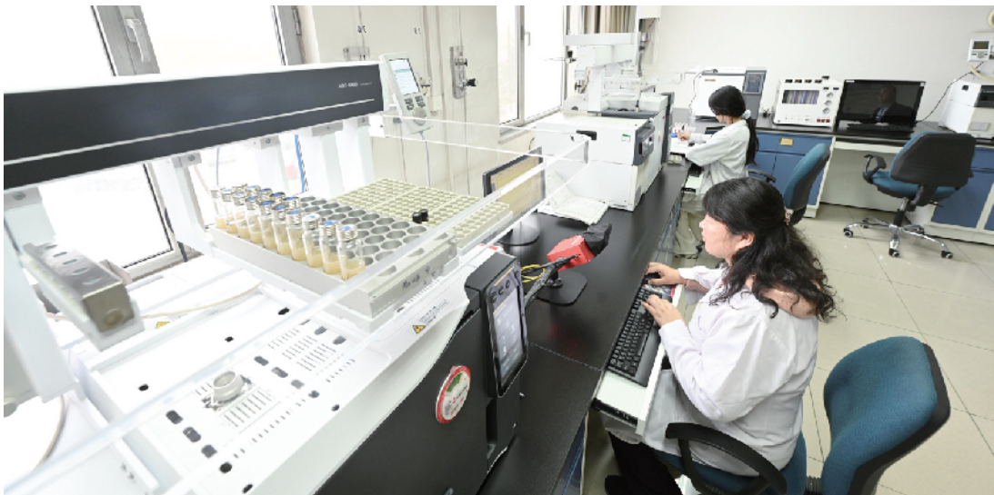
除人工检测外，还要依靠先进的检测设备