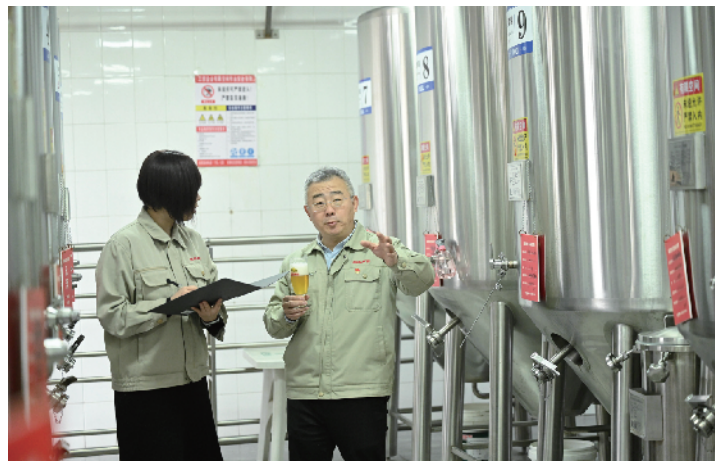
啤酒实验室相当于一条小型化生产线

索出的工作室模式让创新不仅停留在论文里，更扎根于车间与市场，确保每个成果能切实提升产品品质与获得市场认同。”林智平说，“未来，我们将打造出更多符合消费者需求的特色好产品，让每一杯啤酒不仅好喝，更能承载故事与情感，打造真正属于中国人、更适合中国人口味的精品啤酒。”