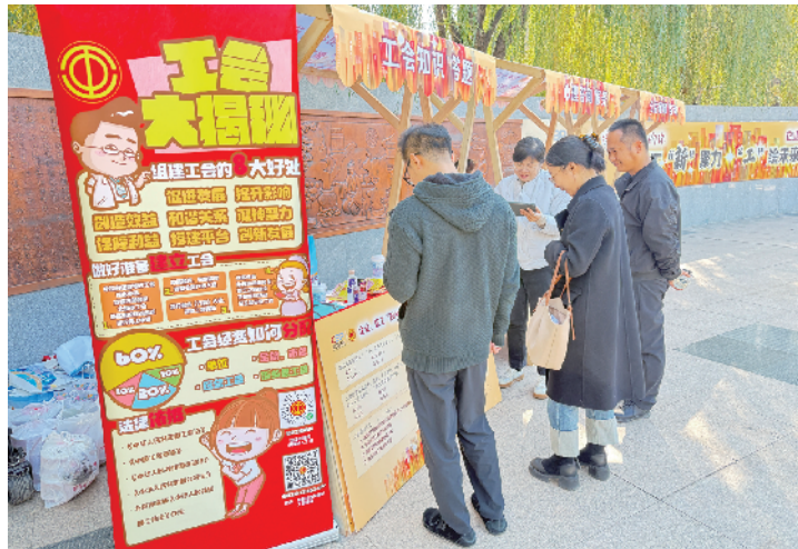
工作人员向广大职工集中宣传工会服务