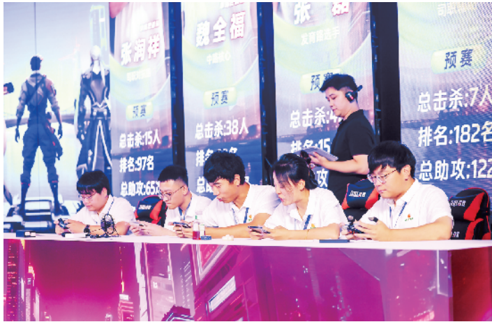
赛场上,职工们化身电竞选手

职工音乐节激情开唱、乒乓球羽毛球联赛热血角逐、电竞风云汇精彩上演、读书市集书香弥漫……2025年,大兴生物医药基地文化体育盛宴轮番登场,生动勾勒出“在中国药谷快乐上班”的幸福图景。这背后,是大兴生物医药产业基地总工会不断夯实“组织链”、完善“保障链”、创新“服务链”,以建会全覆盖、服务精准化、维权专业化、活动品牌化提升工会服务质效,为中国药谷高质量发展贡献“工”力量。