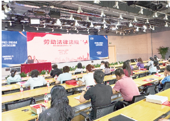
园区企业工会负责人通过培训提升法律意识与业务能力

下一步,基地总工会将继续以“链”为纽带,以职工需求为导向,全力构建具有生物医药行业特色的工会服务体系,为中国药谷高质量发展注入更加强劲、更可持续的工会力量。