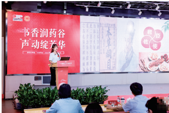
职工以语言为媒、以思想为魂在“书香药谷”演讲比赛舞台上展开角逐