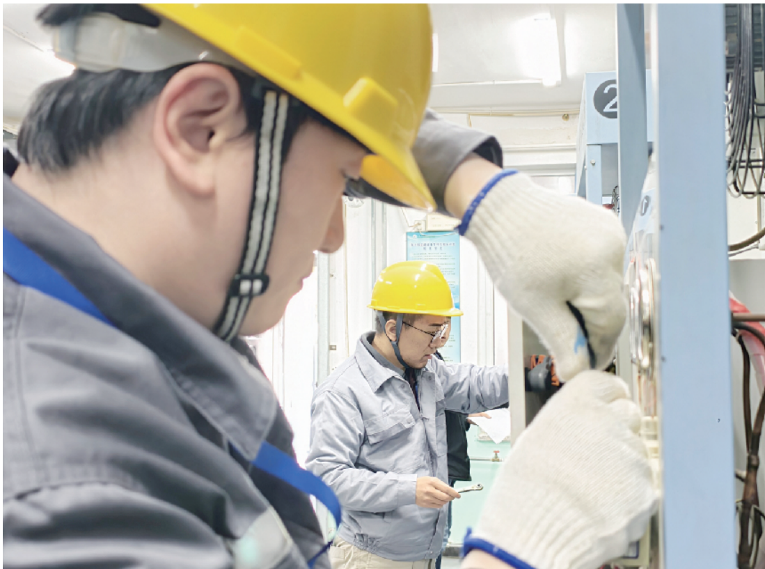
赛场上，选手认真完成各项操作