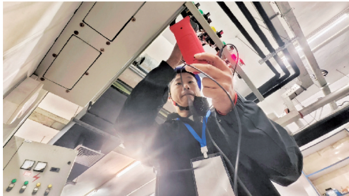
选手在制冷设备故障判断与排除操作环节认真操作