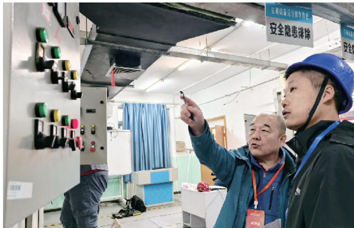
比赛中裁判耐心解答选手疑问