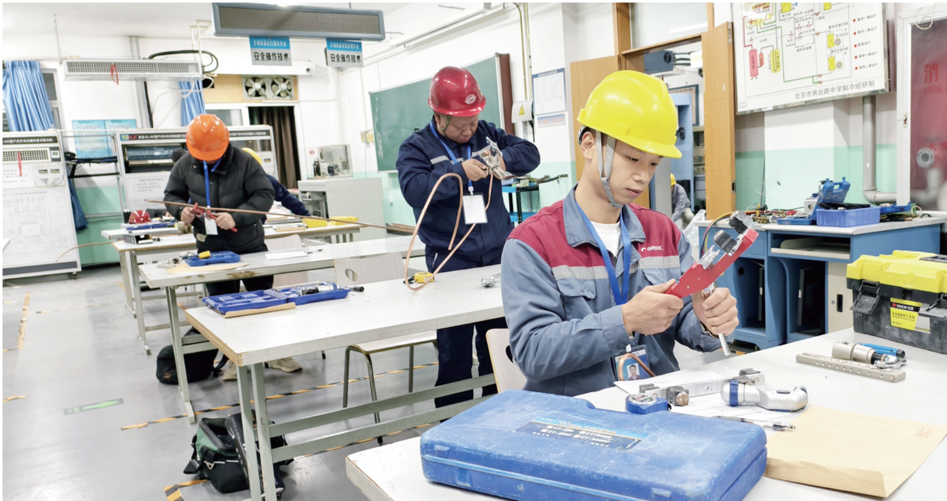
选手们在比赛中需通过笔试和实操两部分比拼