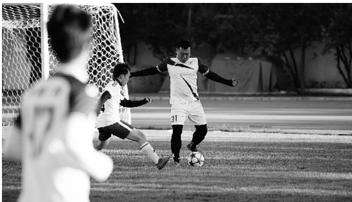
怀柔区总工会代表队(持球方)和北京市工业(国防)工会代表队在比赛中

以4:0战胜北京市教育工会代表队。这就让接下来北京市工业（国防）工会代表队和怀柔区总工会代表队之间的比赛弥漫“紧张”的气味。