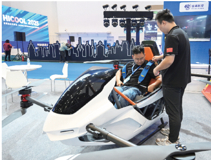
在科大硅谷展区，猛狮智能飞行模特作为国内首款瞄准民航标准合规性设计的超轻型智能飞行器，未来将为更多人提供安全、高性价比的低空飞行体验