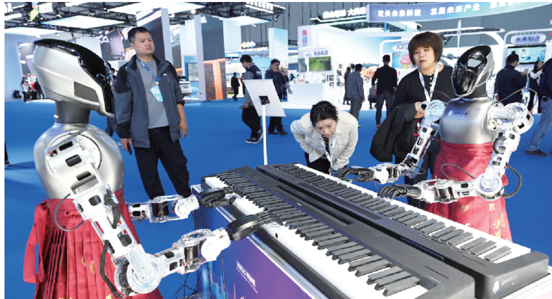
在海淀展区，“灵心乐府”钢琴机器人为观众带来一场科技范十足的音乐表演