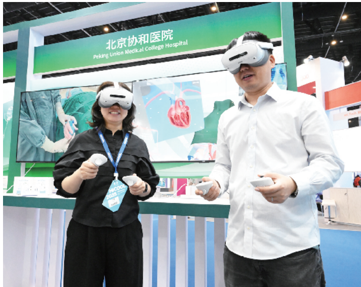
北京协和医学院带来项目“基于混合现实技术的心肌活检穿刺模拟教学工具”，用数字场景还原手术操作过程