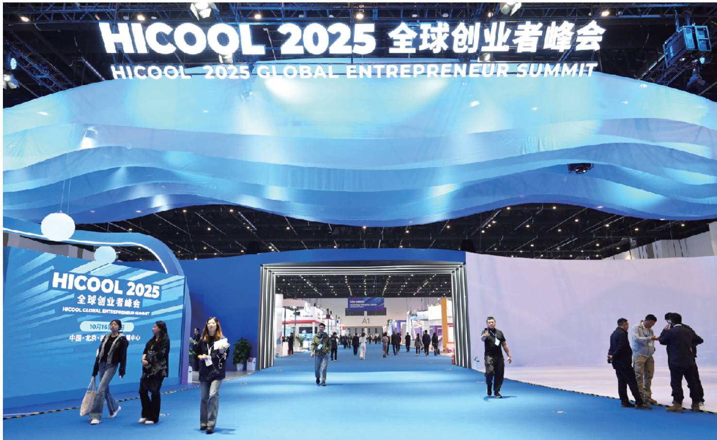
10月16日，以“打造全球创新创业生态之都”为主题的HICOOL 2025全球创业者峰会在北京·首都国际会展中心举行