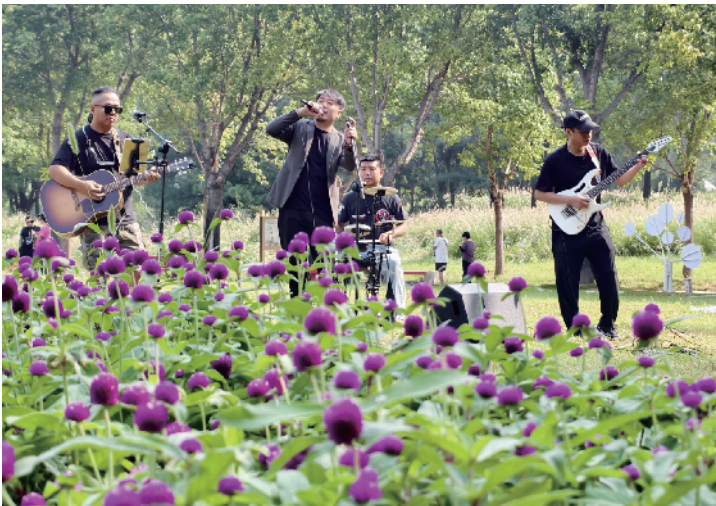
民谣乐队的驻场为赏花增添了不一样的代入感

据了解，本届文化节以菊花为媒、以游园为乐，北京国际鲜花港联合北京花木公司，着力打造“基础地景+精致花境+网红打卡装置”等多维度景观，总种植面积达10.6万平方米。其中，南门至花神广场借鉴英式园林美学，以千头菊、硫华菊、马鞭草搭配高枝紫菀、宿根鼠尾草等，打造兼具景深与韵律的“植物剧场”；百花田至樱花大道以缓坡为画布，用醉蝶、麦秆菊勾勒流动色带，东翼大波斯菊与跳泉旁的球菊矩阵，演绎秋日华章；幻花湖至水杉林借湖面倒影打造“镜中花海”，呈现反季节花卉与亲水植物的梦幻交融；大地花海北区融合荷兰花海设计手法，蓝紫色马鞭草花海与机械雕塑跨界