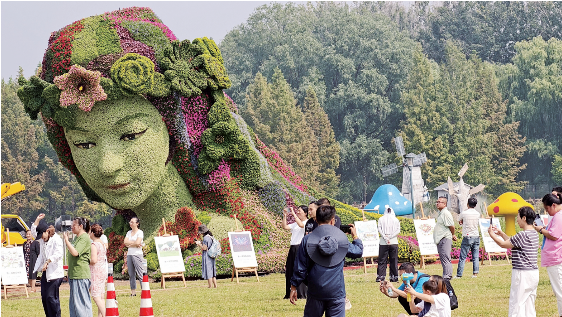
精心雕琢的立体花坛“花神归家”成为标志景观