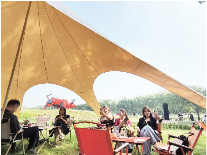
游客们在鲜花装点的草坪上露营拍照

据悉，活动期间，园区蝴蝶大世界免费开放，解锁沉浸式蝴蝶科普。顺义（首届）家庭花园设计创意大赛作品赏析、民谣乐队驻场、NPC互动打卡、鲜花市集、露营咖啡、儿童乐园等一系列主题活动也同时开展，将为市民打造极具特色的文化、娱乐消费新体验。