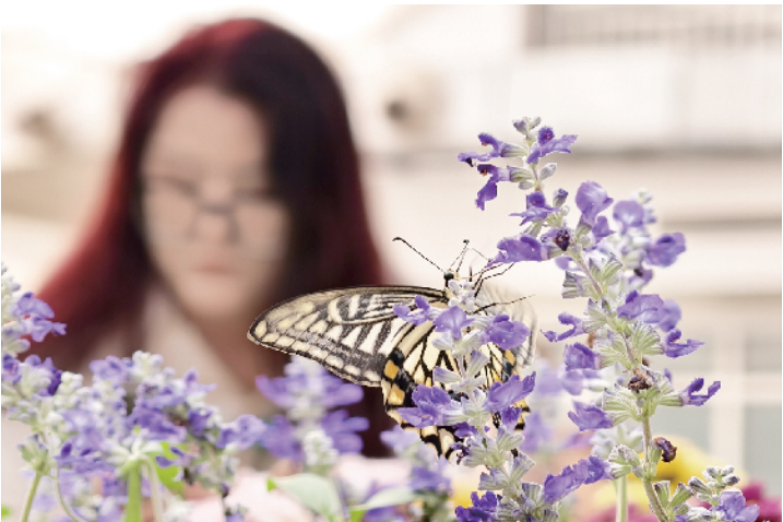
园区的蝴蝶大世界，游客在此邂逅别样的花海浪漫