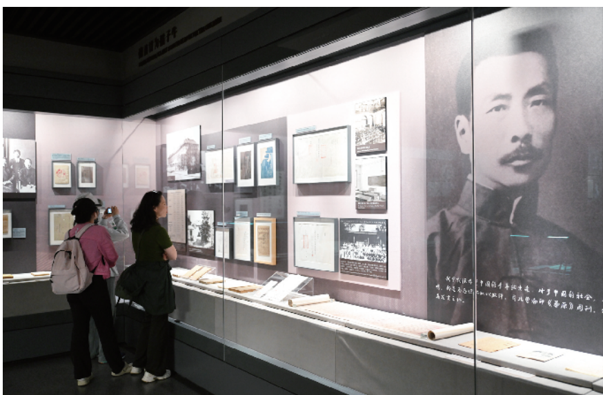
鲁迅博物馆中大量的实物、手稿、图片向观众展现了鲁迅先生极不平凡的一生