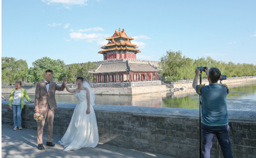
故宫角楼，许多新人选择在此拍摄婚纱照，作为爱情的见证