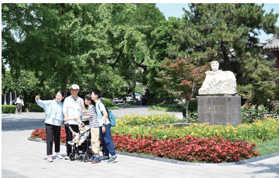
在鲁迅博物馆，游客与鲁迅先生的半身塑像合影留念