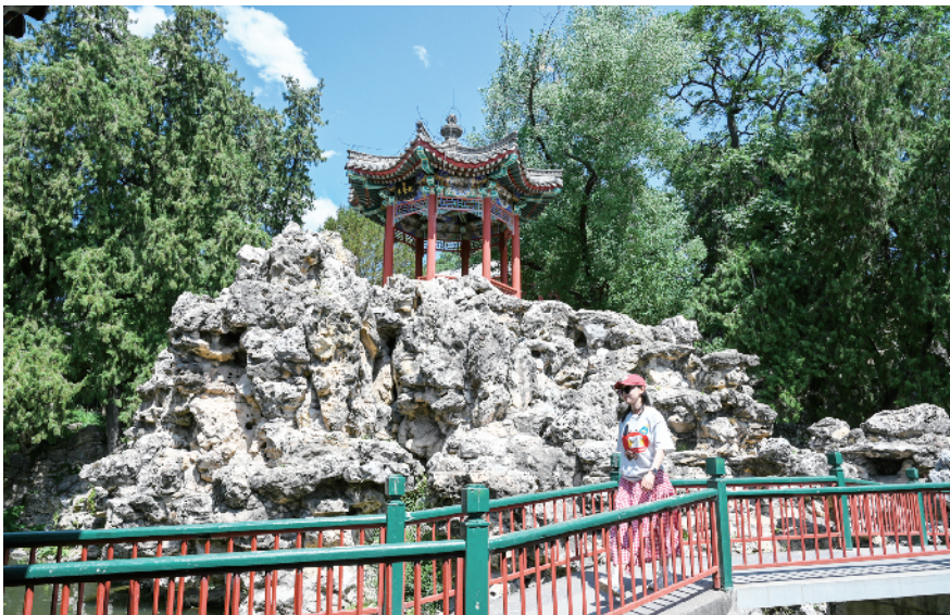
静心斋被称为北海公园最美的园中园，堆山叠石，小桥流水，有着苏式园林的韵味