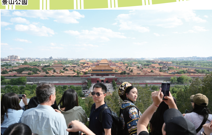
在景山公园的万春亭上，整个故宫尽收眼底