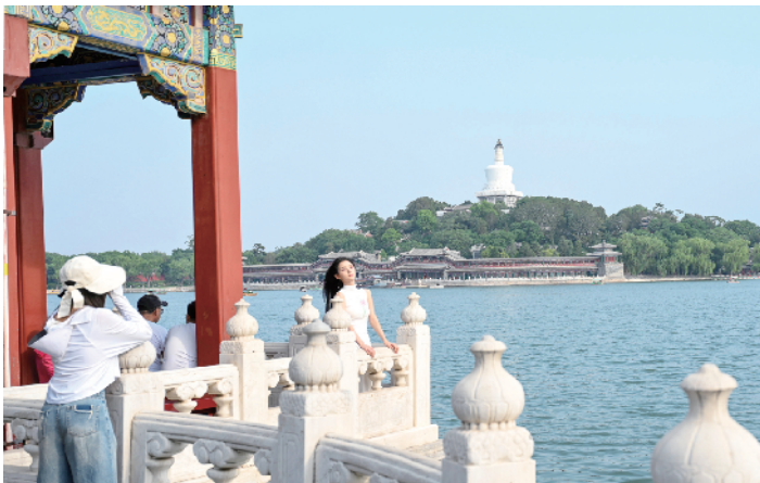
作为皇家园林局的“顶流”，北海公园汇聚着来自五湖四海的游客