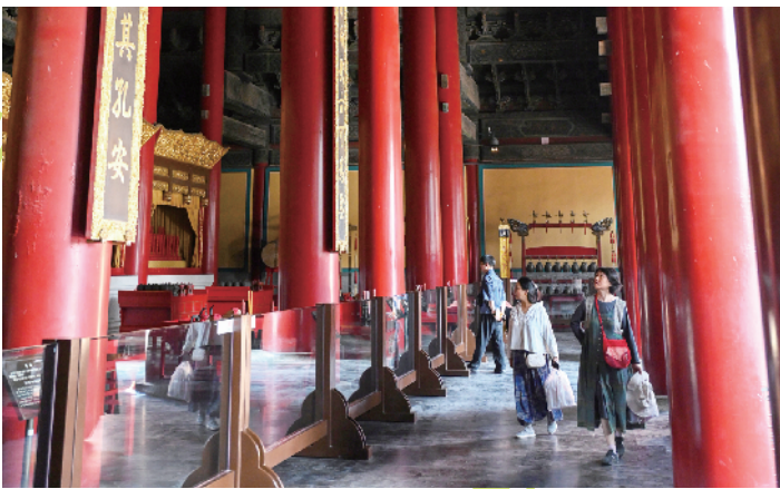
历代帝王庙内供奉着从伏羲、黄帝、商汤到明代帝王的188位帝王牌位