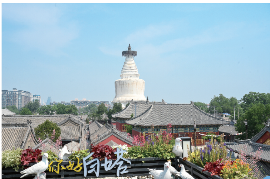
登上网红咖啡馆的二层露台，白塔美景尽收眼底