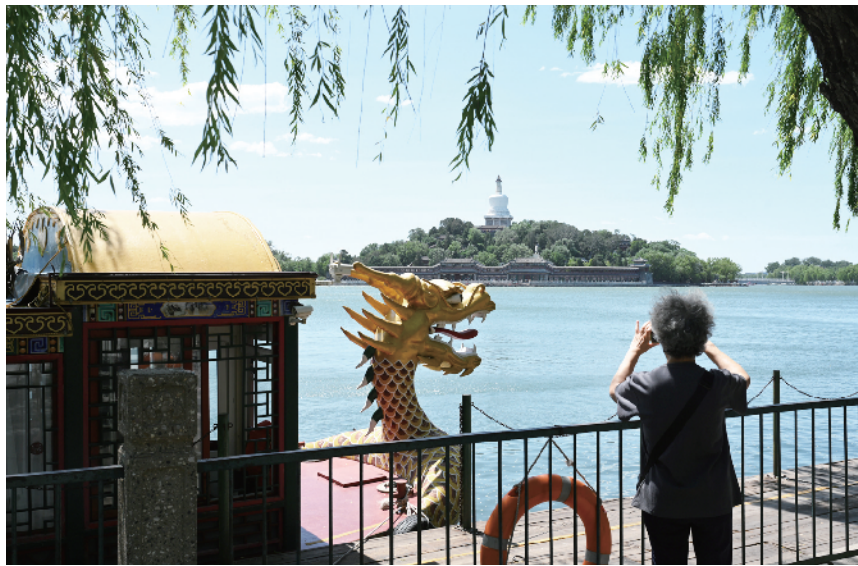
沿着北海公园的湖边走一走，是许多市民放松心情、自我治愈的方式