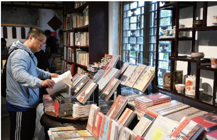
正阳书局专营北京相关书籍，北京城的往事在这都能找到答案