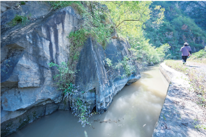
河水引入细长“几”字形灌渠，经过5座山洞，灌溉周边村落农田后，退水又返回永定河主河道