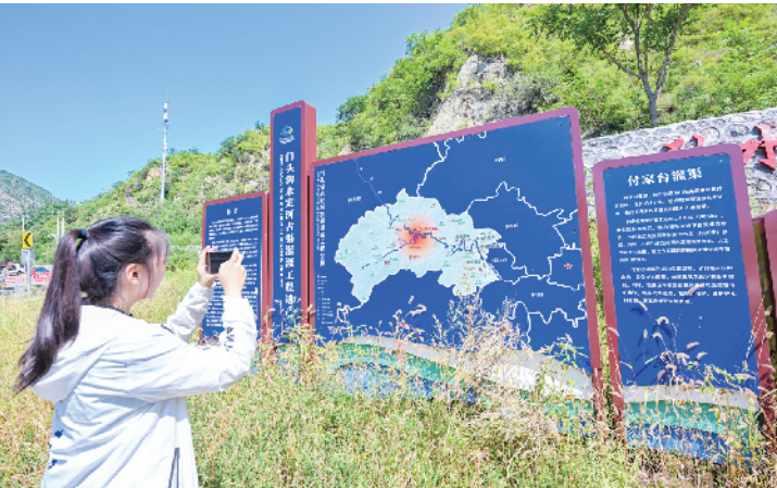
公议沟、三家店、丁家滩、城龙、付家台五条核心古灌渠，再加上周边多处古井、古泉等众多遗存构成了庞大的灌溉体系