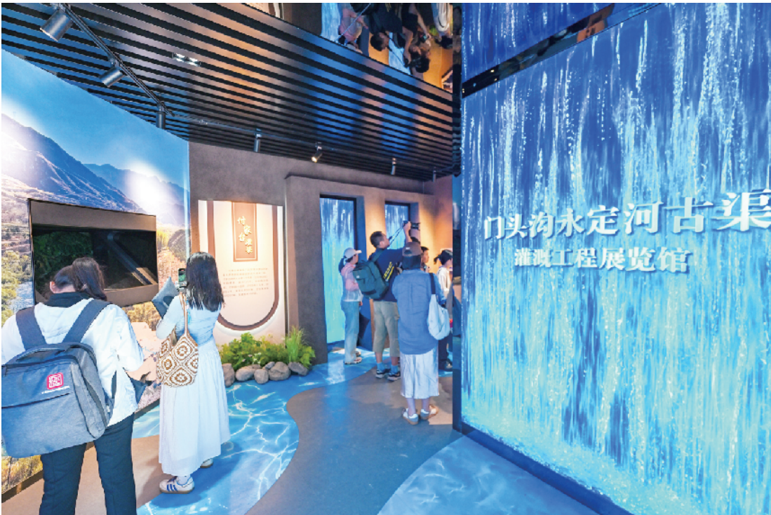
永定河古渠灌溉工程展览馆详细记录了古灌渠灌溉工程的前世今生

古灌渠工程作为见证了北京千年治水智慧、区域发展与建都史脉的活态遗产，经受住了多次洪水灾害的严峻考验。如今，位于门头沟城区的城龙古灌渠成为了“六水联通”工程的核心，正助力生态补水，附近的234处泉眼正逐步实现“百泉复涌”。