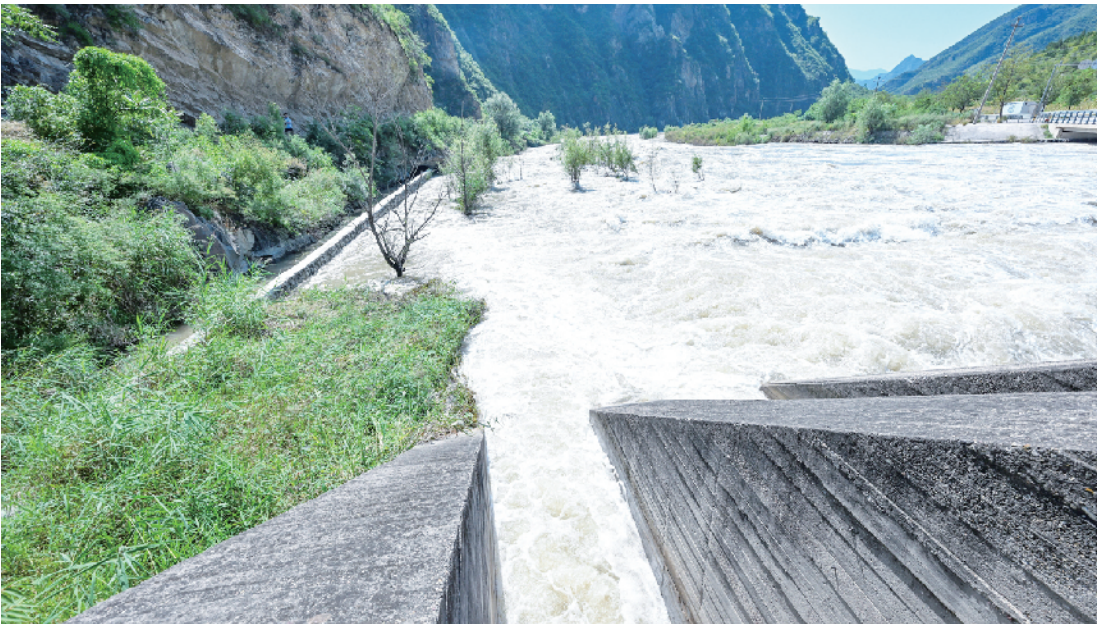
永定河古灌渠取水口大都设置在“迎水侧”，有径流流速大、泥沙含量少等特点