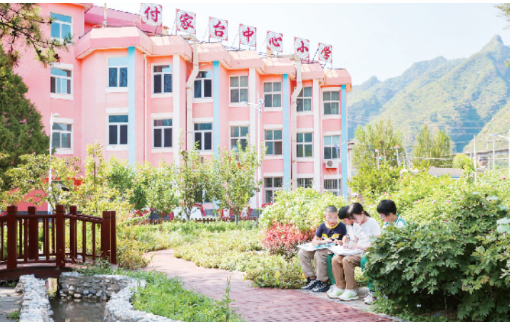
付家台中心小学将古渠的潺潺流水引入校园，构筑了融合教育、生态、文化于一体的古渠教育课堂

2025年9月10日，在马来西亚吉隆坡召开的国际灌排委员会第76届国际执行理事会会议上，北京门头沟永定河古渠灌溉工程正式接过“世界灌溉工程遗产”认证证书。这不仅是北京市首个获此殊荣的水利工程，更实现了京津冀地区世界灌溉工程遗产“零的突破”，让流淌千年的京西水脉，在世界舞台上绽放出了璀璨光芒。