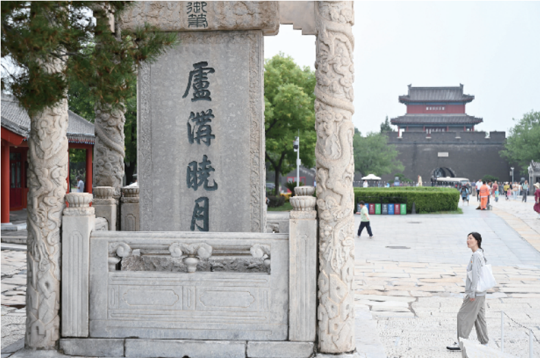
卢沟桥已经有800多年的历史