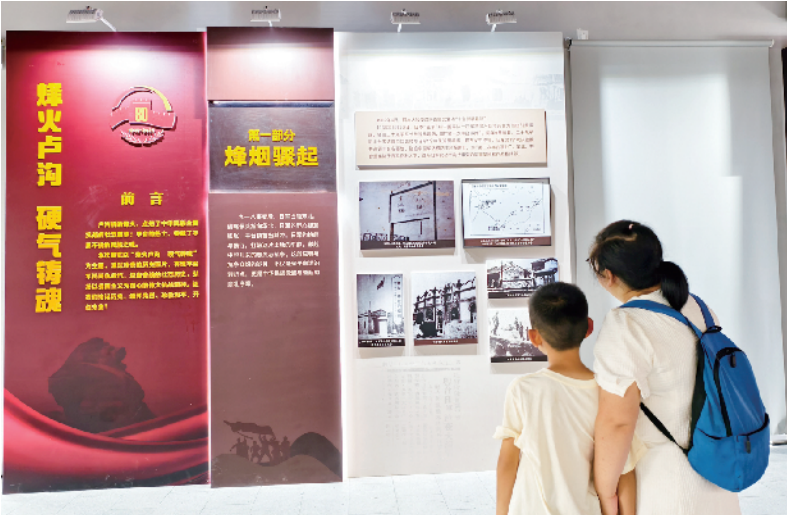
大量的观众来到宛平城内，接受抗战历史教育