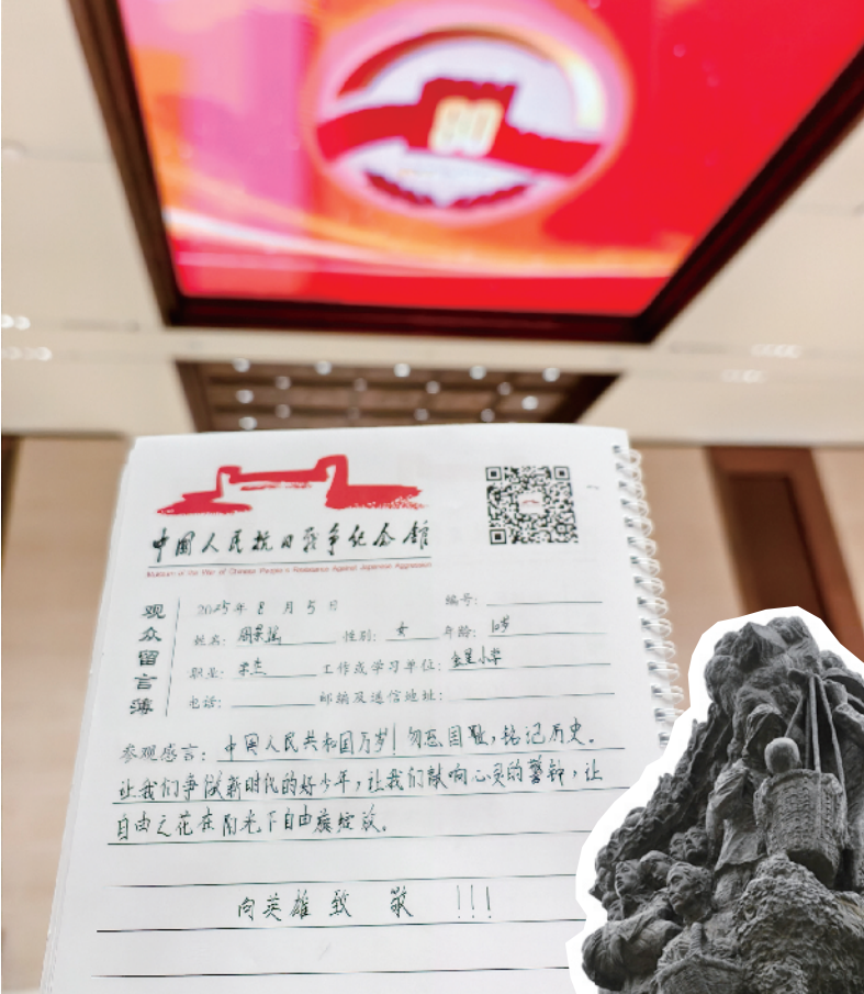
观众在抗战馆的留言簿上留下许多动情的感言