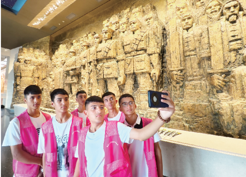
来自新疆的中学生，在抗战馆缅怀先烈