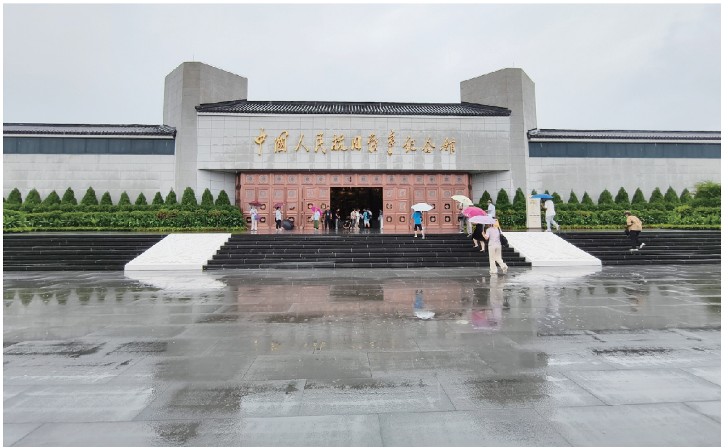
即使是大雨天，来到抗战馆瞻仰的人还是络绎不绝