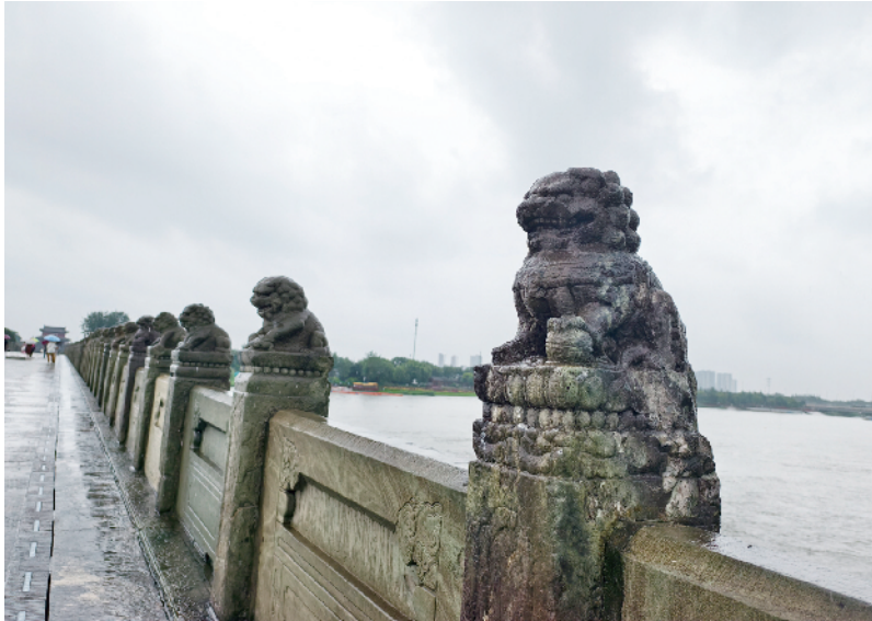
卢沟桥上的狮子，见证了全民族抗战的光荣历史

一位参观者的感言代表了千千万万和平守望者的心声。不竭如江河，无穷如日月。热血宛平城与它承载的荣光，将永远被铭刻在中华民族的复兴史册之上。