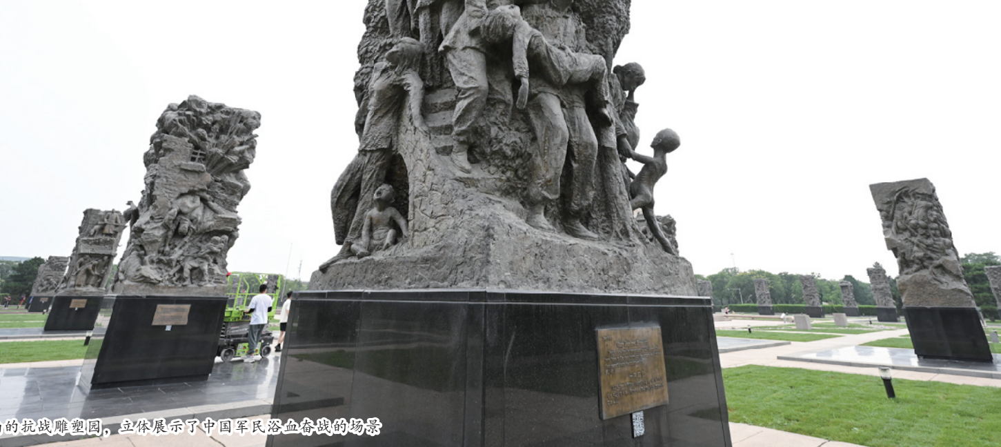
宛平城南的抗战雕塑园，立体展示了中国军民浴血奋战的场景