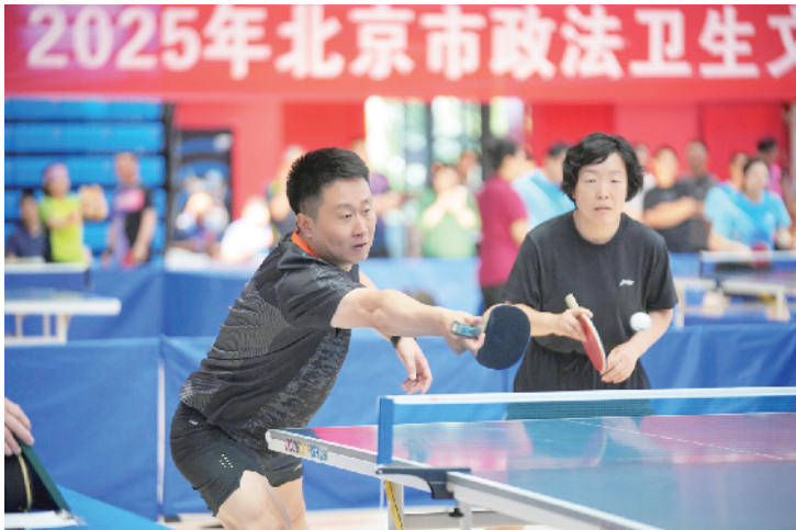
选手在赛场上激战正酣