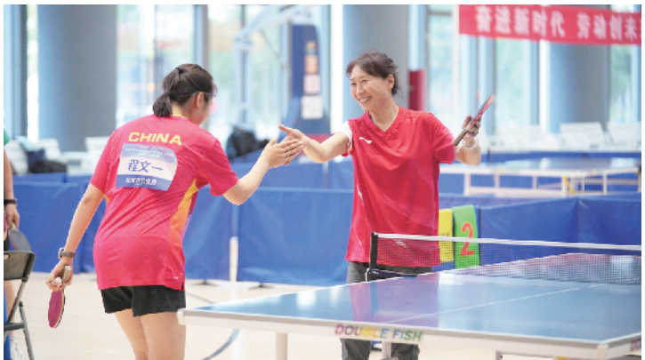
比赛结束后双方击掌握手致意