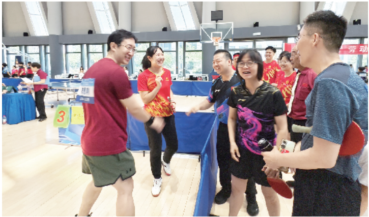
比赛结束，第一时间与队友分享胜利的喜悦