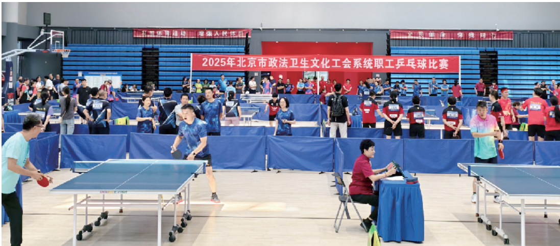
参赛选手尽力展现最高水平的球技