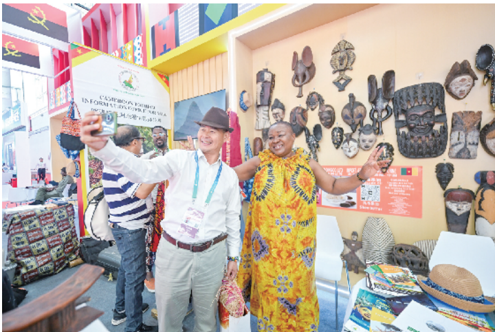
在供应链服务展区，展示着多个国家的特色产品