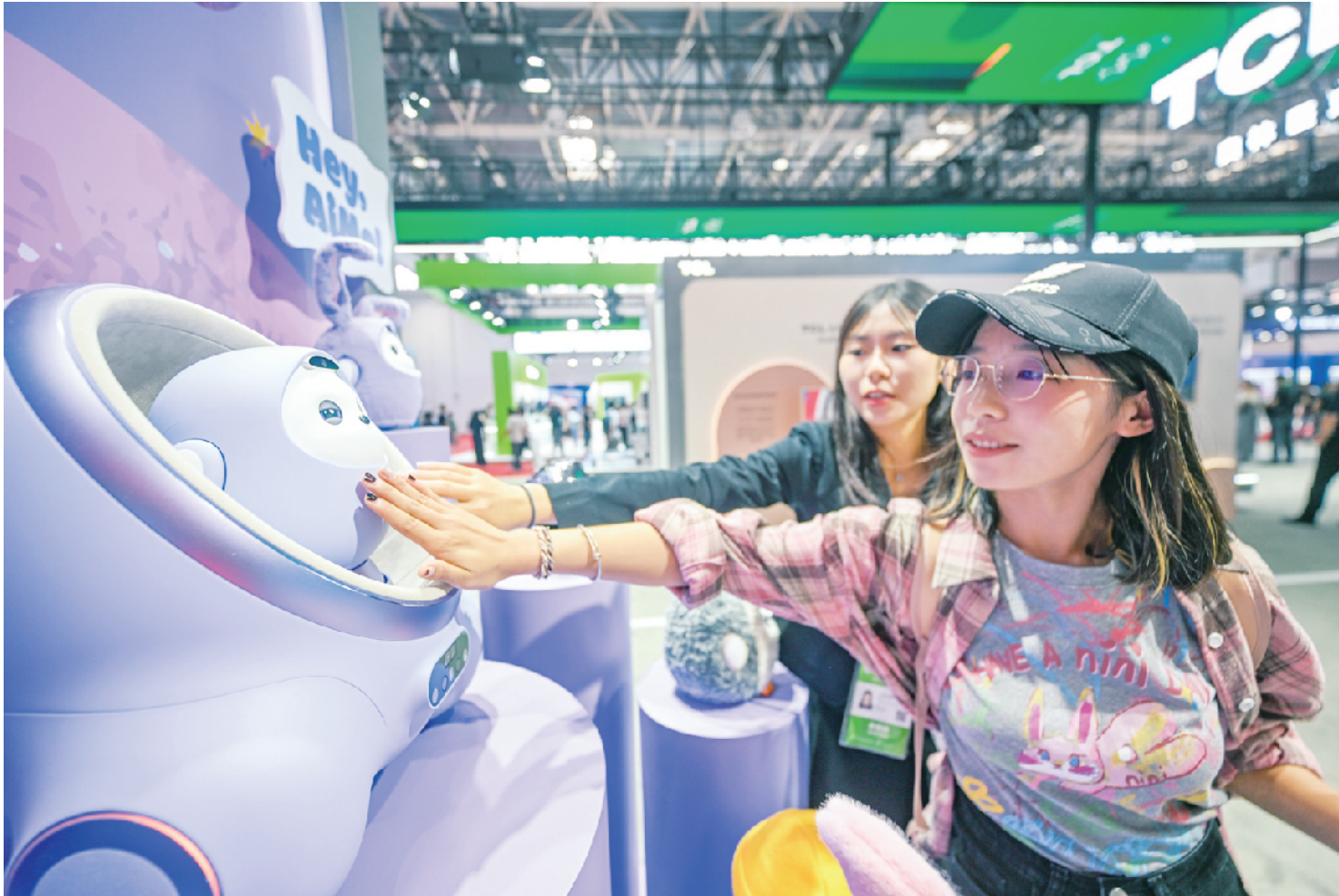
观众与分体式AI陪伴机器人互动

此外，链博会现场还设供应链服务展区，新增创新链专区和“链博首发站”。其中，“链博首发站”围绕“新产品、新技术、新工艺、新场景、新生态、新链条”，将集中发布第三届链博会参展企业在产业链构造和建设中的重点突破和前沿技术，集中展示全球供应链最新技术与产品创新成果，展现产业链协同创新的最新趋势。