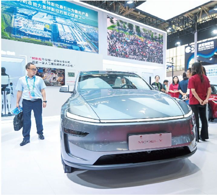
在智能汽车链展区，特斯拉中国展出热销车型