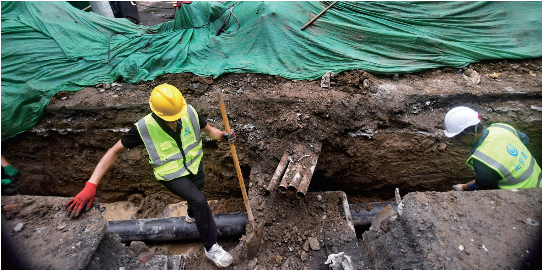
职工进行更换新管道作业