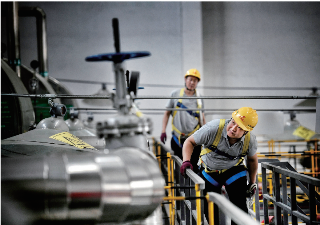
职工在锅炉房例行巡检

对于供暖职工来说，维修季的活可不轻：除了完成户外作业部分，户内的节点阀门更新、换热站循环泵进出口更换阀门、各类设备保养以及居民家中的管线阀门修理等都要在供暖季来临之前完成。“‘冬病夏治’完成得好，今年冬天的供暖就有了可靠保障。”供热平台的职工对记者说。