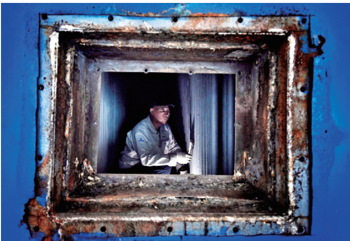
职工在锅炉内检修

一年有四季，但对供暖职工来说只有两季——供暖季和维修季。3月15日停止供暖后，3月16日，师傅们就开始户外管网改造工作，他们要在雨季大范围来临前结束户外改造，这就是供热业内的“冬病夏治”。