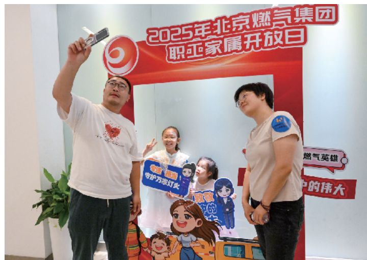
职工家庭在展板前打卡拍照，记录美好时刻