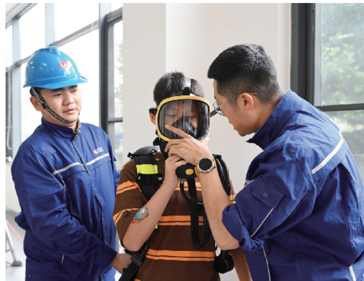
小朋友体验穿戴燃气井下救援设备