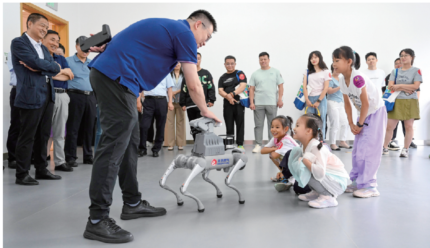
燃气巡检精灵一亮相便吸引了孩子们好奇的目光