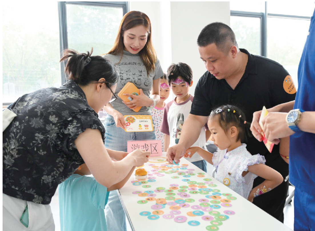
小朋友们通过游戏的形式找出菜品的原材料，认识食物的过敏原

“巡检精灵”机器狗互动，学习厨房里的燃气安全知识，体验穿戴燃气应急救援装备……近日，北京燃气集团职工家属开放日暨安全月活动在北京燃气集团教育技能中心举行，主题为“看见平凡中的伟大——致敬您家中的燃气英雄”。来自北京燃气集团一线的60个职工家庭参与活动。