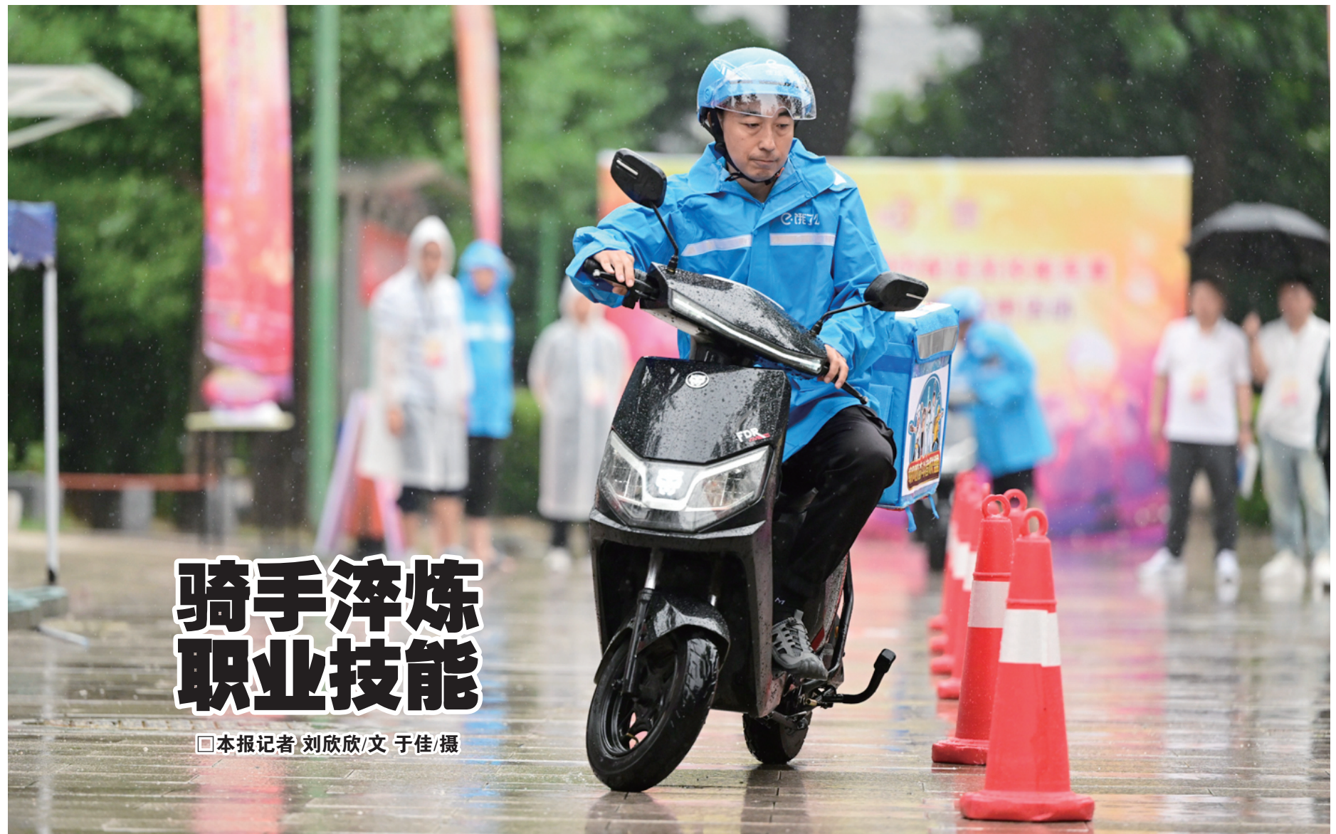
雨中比拼骑行技能