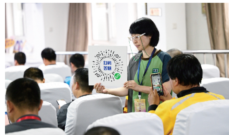
参赛选手扫码答题