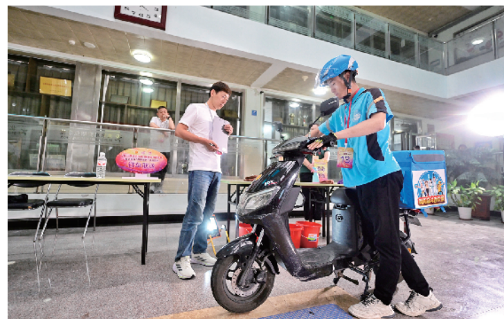
选手对车辆及装备进行检查