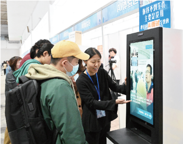
AI模拟面试吸引了众多求职者的踊跃尝试