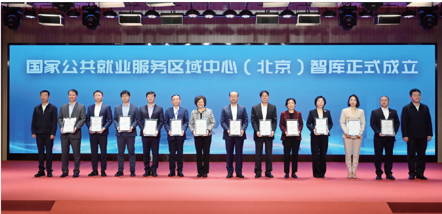
国家公共就业服务区域中心（北京）智库成立

在招聘会入口处，一排展位格外引人注目，2025工会帮就业行动系列招聘活动北京专场在此同步开展，现场设置建会入会、职业指导等服务台，并由专业人