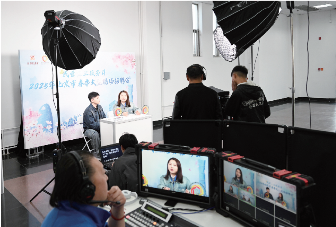
招聘会推出“云招聘”直播环节，通过线上直播向求职者介绍企业和推介就业岗位，求职者可在线上完成简历投递