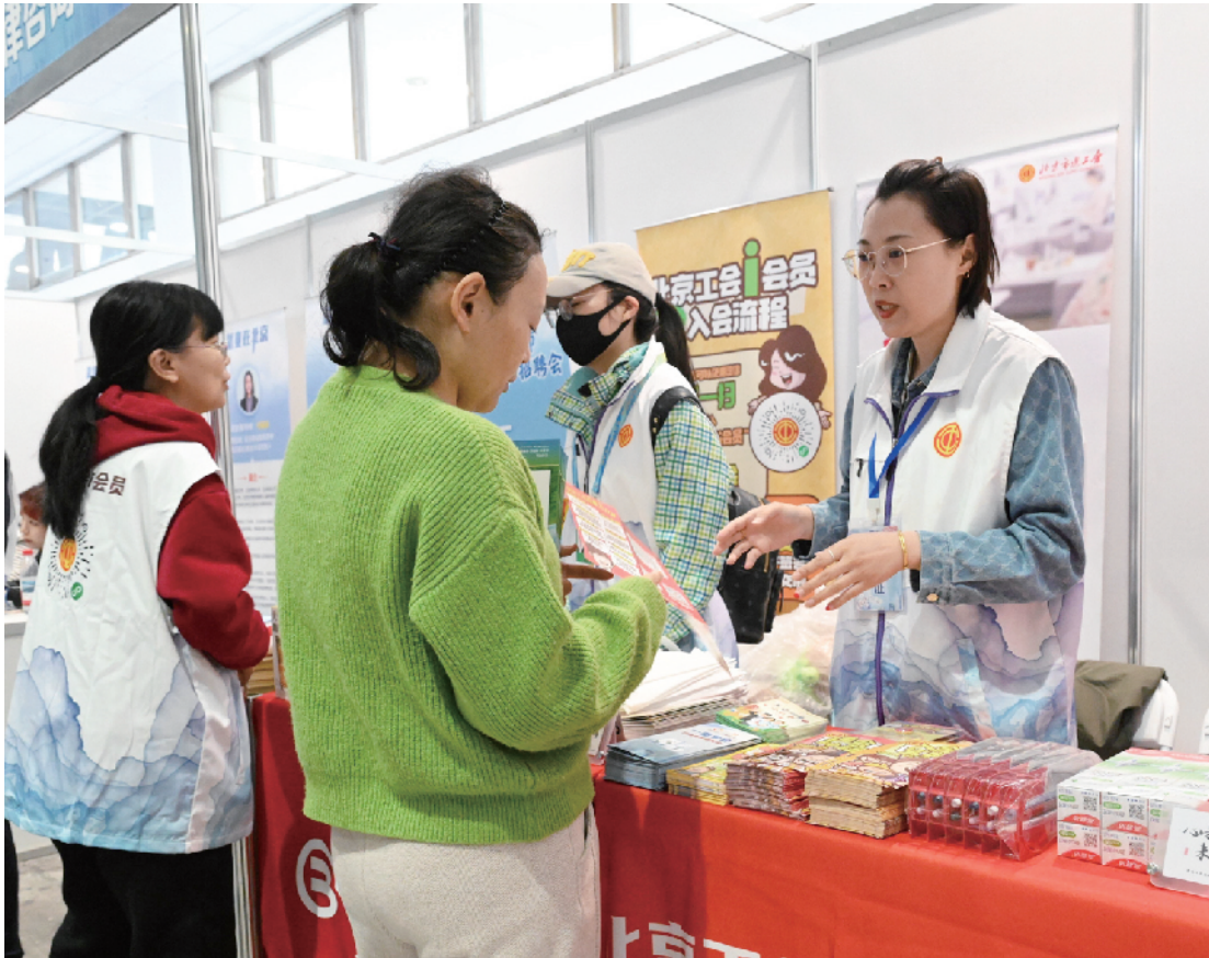
工会工作人员为求职者介绍工会的各项职责、服务以及入会的流程