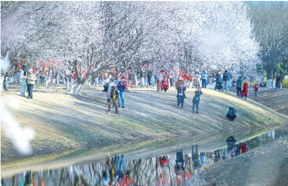
奥森北园蜿蜒水边的桃花林，美得让人心醉