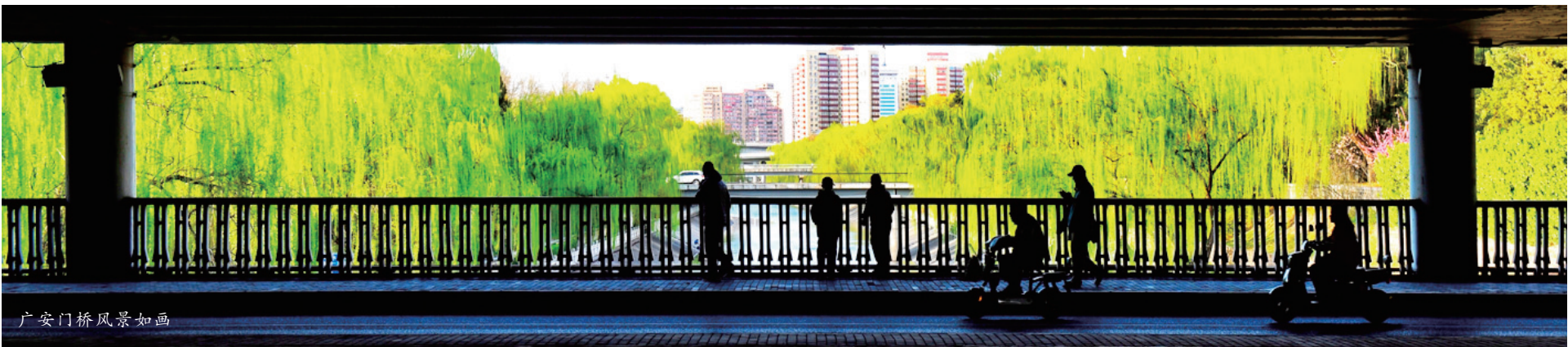
广安门桥风景如画