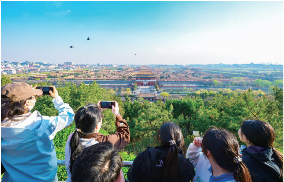
市民游客在景山公园登高远眺，感受京城之春