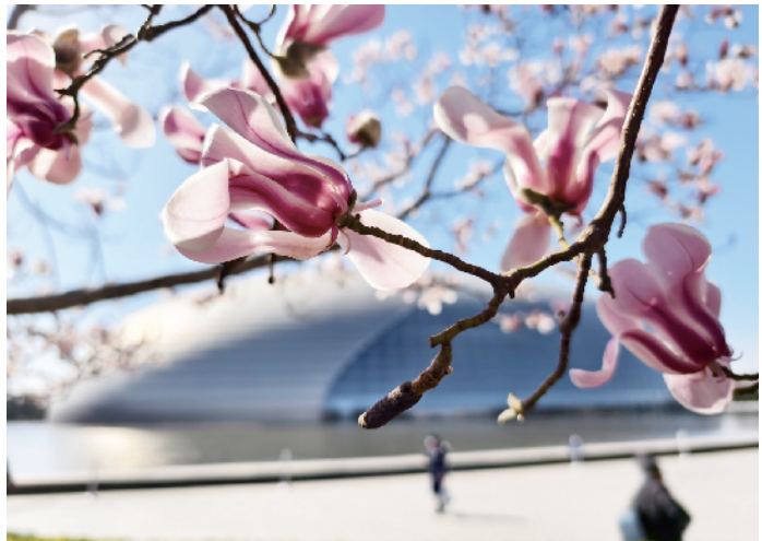
▲国家大剧院门前的玉兰盛开，十分美丽