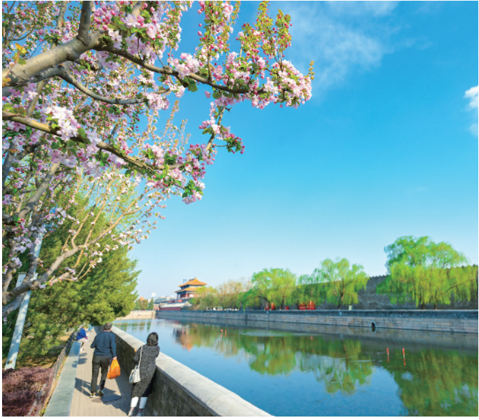
环绕故宫外围的筒子河边，海棠花开美如画