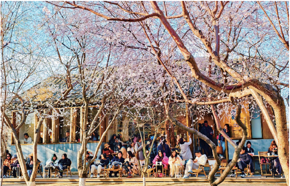
三里河公园山桃花绽放，人们在灼灼的山桃树下赏花拍照，呈现出一幅“桃花源”的闲适场景