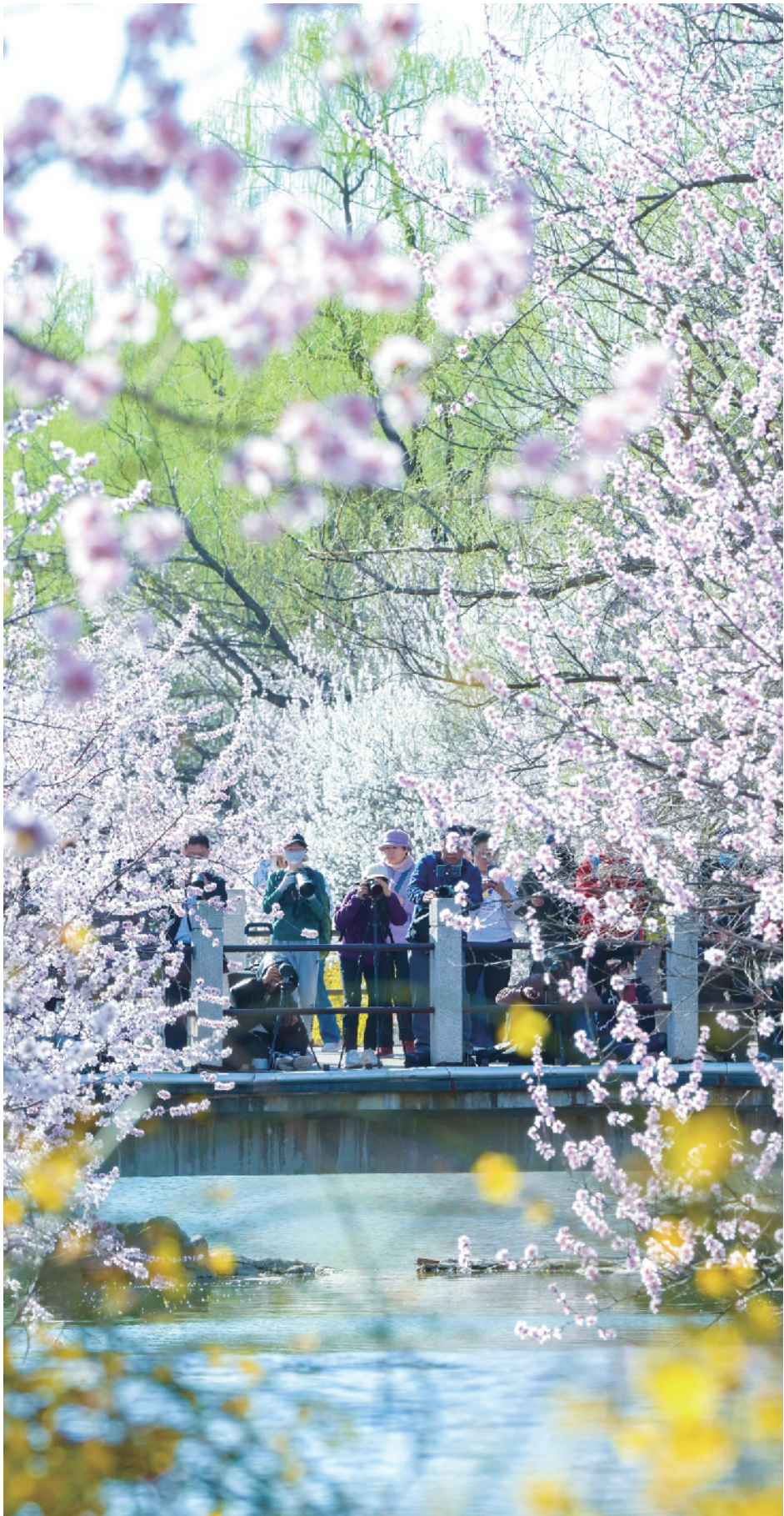
国家植物园北园桃花盛开，吸引大批摄影爱好者