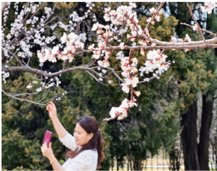
天坛公园山桃花下，游客与好友视频共赏春色