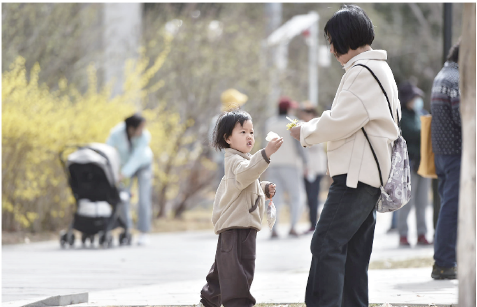
游客拾起地上的落花，“触摸”春天