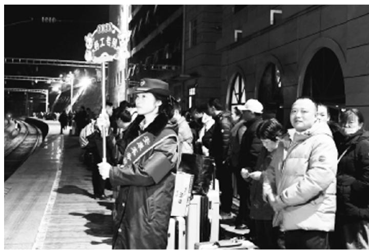
和资金方面的扶持，也要加大技能培训 and 品牌推广力度，为他们提供全方位就业服务。