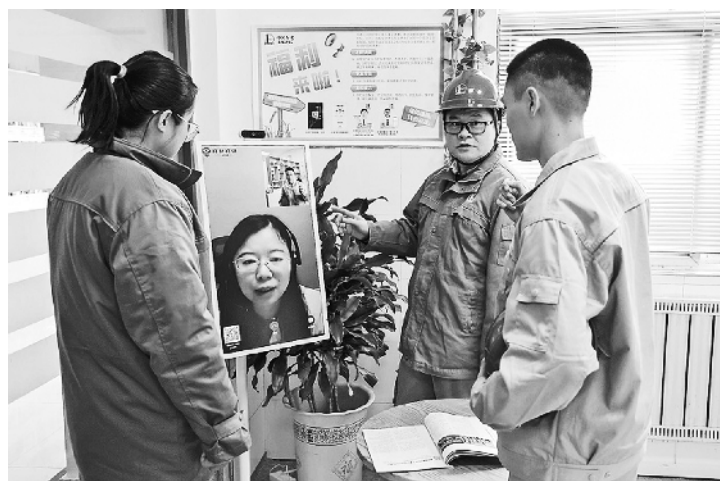
护能力，为他们撑起了健康安全“保护伞”。我们衷心期待生

笔者以为，中国石化扬子石化公司在生产一线配备“健康管家”，不仅把医疗服务直接送到了职工身边，让他们能够随时了解自己的身体状况，减少和降低健康安全风险，防患于未然，而且便捷的健康服务，还起到了普及医疗科普知识和技能的作用，可以进一步增强一线职工的健康意识和自我保