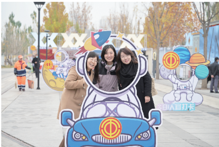
活动现场工会元素满满，不少职工前来拍照打卡

海淀区人大常委会党组成员、副主任，区总工会主席李卫华表示，本次科技大集活动是对海淀科技创新的雄厚实力和蓬勃活力的生动展示，更是对劳模精神、劳动精神、工匠精神的大力弘扬。未来，区总工会将继续努力为广大职工创造更好的工作条件、学习环境和成长平台，让每位奋斗在海淀区的职工都能够感受到工会组织的温暖，共同书写高质量发展的新篇章。