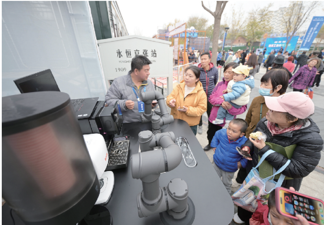
▶参观者被现场的咖啡机器人所吸引