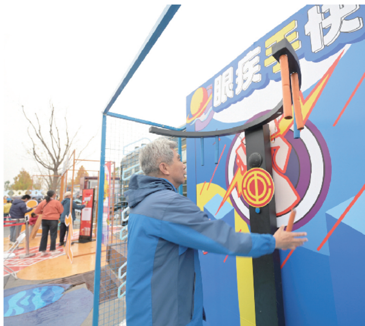
▲现场设置的游戏体验区吸引了不少参观者