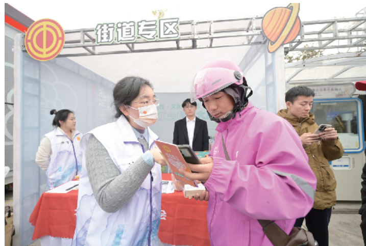
现场扫码入会，工作人员为快递员介绍工会服务项目