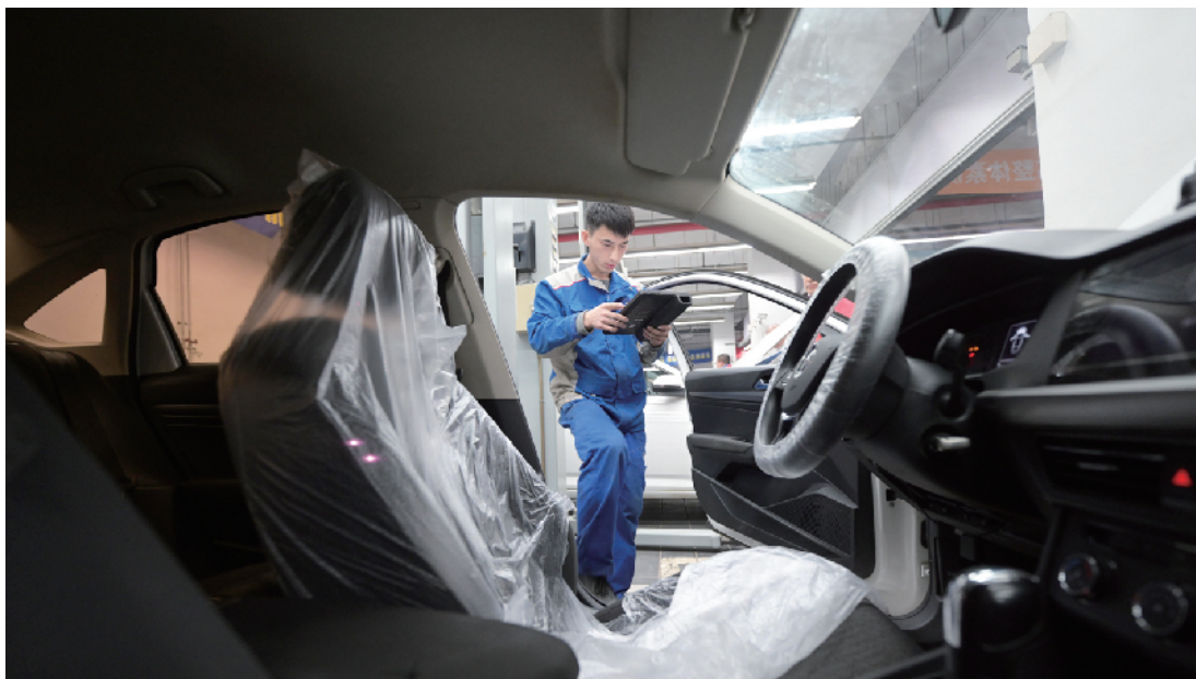
通过专业设备连接行车电脑找到故障位置