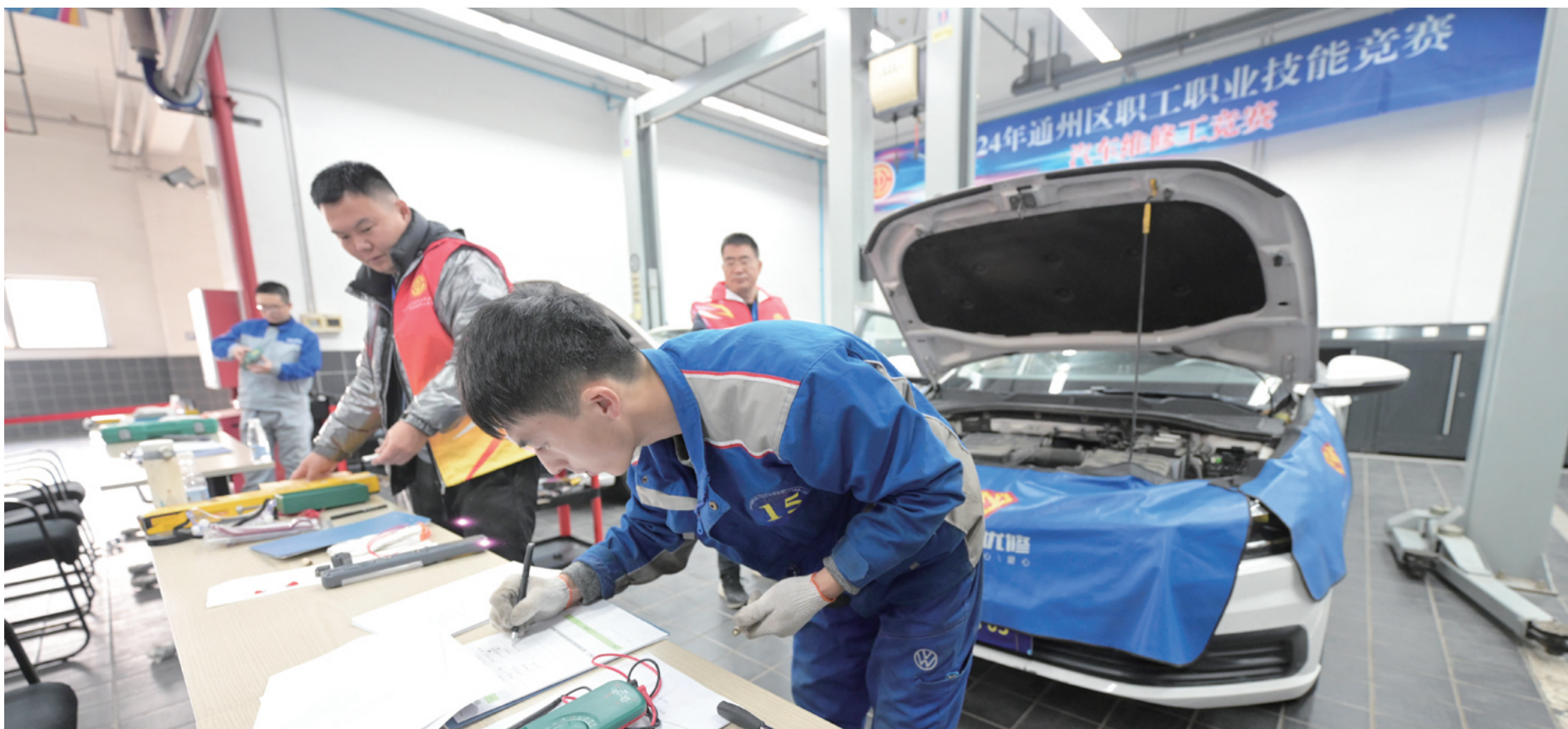
决赛内容为“理实一体化”竞赛考核