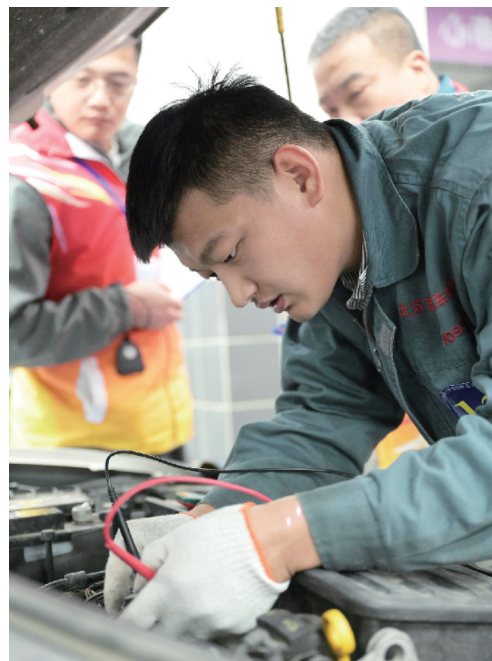
选手全神贯注、一丝不苟