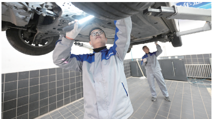
双人底盘检测技能测试