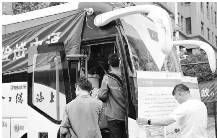
安全感。笔者希望这项服务能够常态化、制度化，让包括快递员

为了市民的生活更加方便快捷，快递一线的劳动者付出了辛勤的汗水。免费体检，为他们的健康提供了坚强保障，同时极大提升了他们的获得感、幸福感、