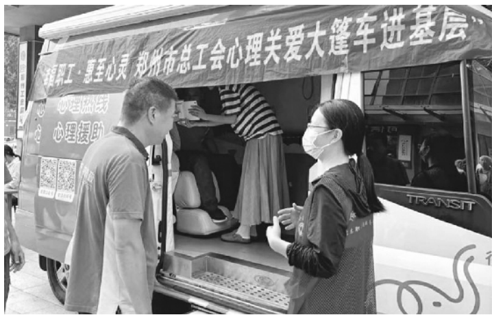
识和防范能力。期待能有更多的心理关爱大篷车开进基层、开到一线职工的心坎上。

社会的稳定。笔者以为，郑州市总工会开展心理关爱大篷车进基层活动，一方面，通过工会的精准服务，实实在在地弥补了基层心理健康管理技能不足的“短板”，为企业和职工排了忧解了难，让他们体会到了心理关爱带来的好处；另一方面，通过心理专家的专业指导和服务，既可以针对性地帮助一线职工解决心理健康问题，提升他们的工作质量和生活品质，又传播了心理健康的知识和技能，可以进一步增强一线职工心理健康的自我保护意