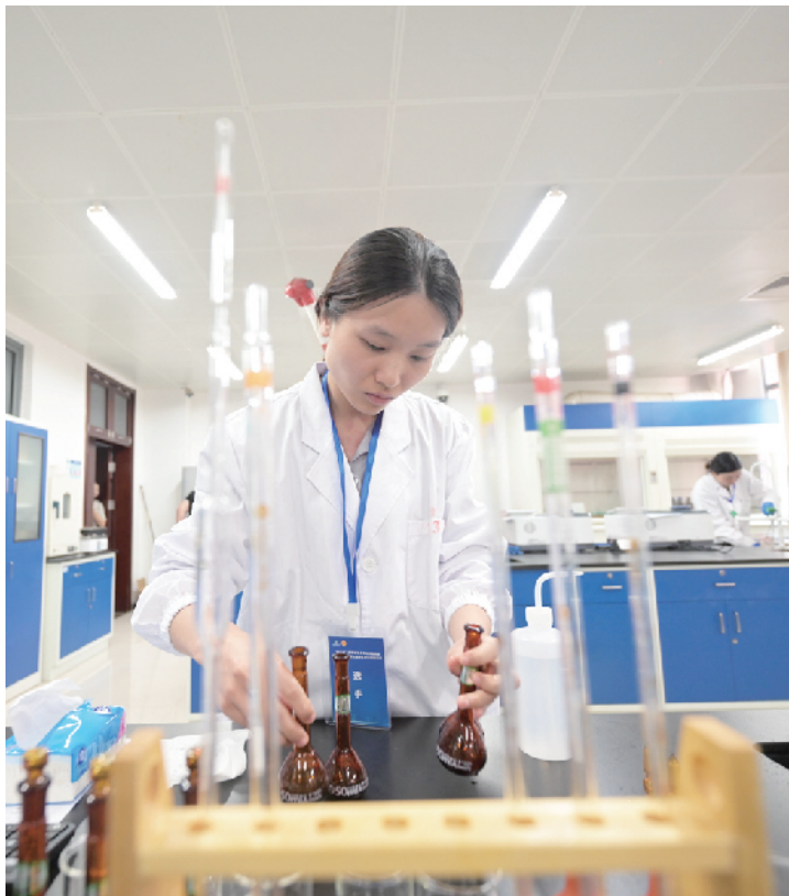
选手清洗实验器具

“本次比赛，我们不但有赛前培训，赛后还将为选手定制提升计划，真正做到以竞赛持续提升技能。”经开区总工会负责人介绍，后续会制定选手的下一步技能提升规划，特别是加强检测的基本功训练以及实操要点系统培训，推动经开区药物检测技能人才水平整体提升。