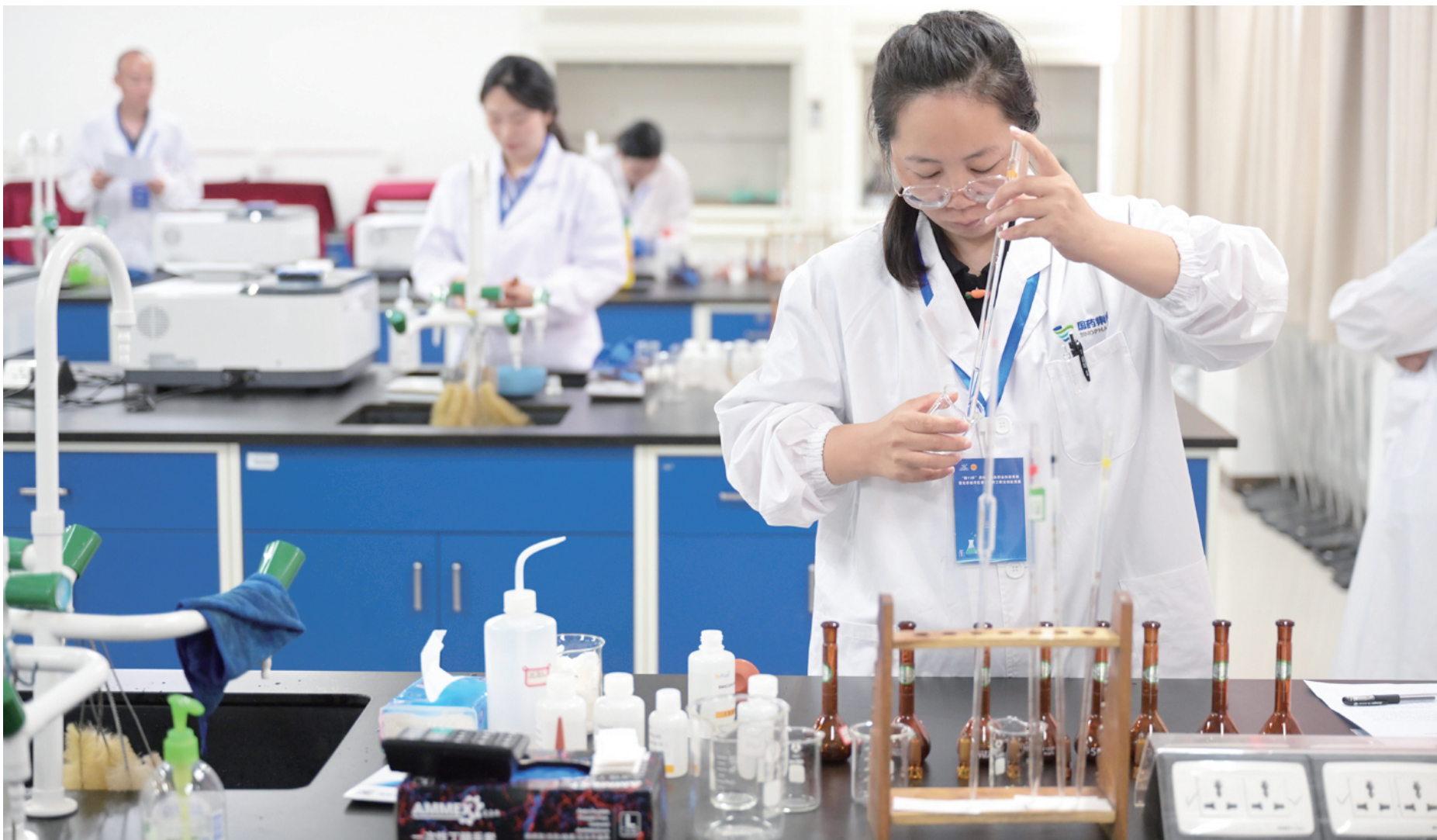
选手全神贯注量取试剂