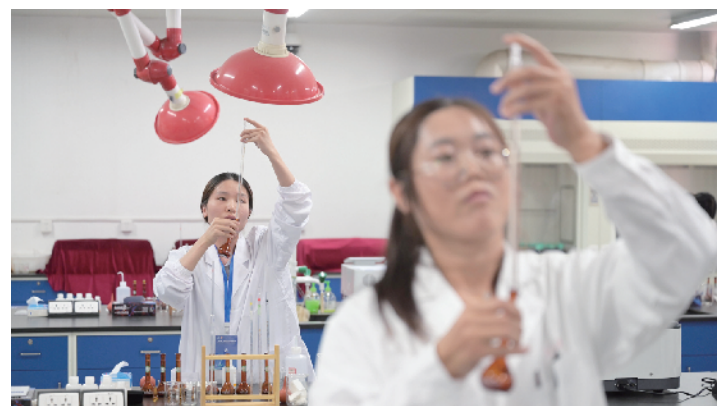
选手的操作过程一丝不苟