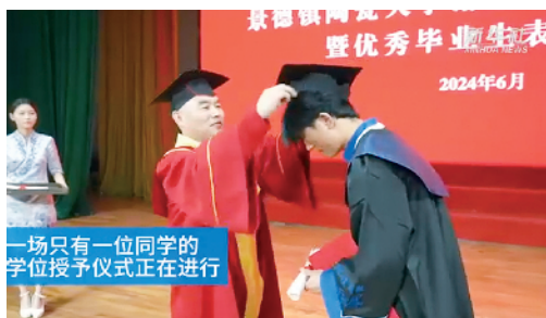
一场只有一位同学的学位授予仪式正在进行

点评：少年强则国强。学生在洗衣房认真学习的劲头值得表扬，不过提醒注意的是，学习还是要在平时用功，最好不要临时抱佛脚。加油，少年们！