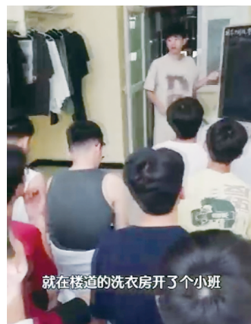
就在楼道的洗衣房开了个小班