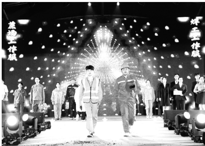
职工，使企业的职工能从无形中感受到有形，增强职工的组织性、纪律性和归属感，从而营造良好的企业秩序。 □胡建兵

企业职工的工装作为企业标识形象的战略先导，由于其本身已经凝聚了一家企业的标准与规范，体现了和谐的团队精神，在它把企业形象传递给一切可以接受该信息的公众的同时，也将企业文化的内涵价值与秩序传递给