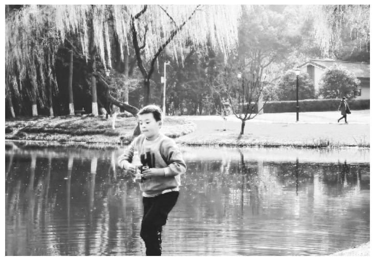
客都能自觉做到“文明旅游”“无痕旅游”，那么，我们身边的