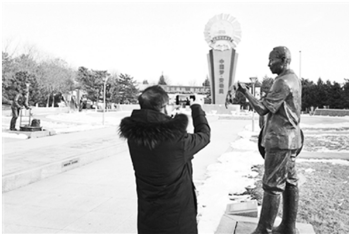
动精神、工匠精神深入人心。同时，还可成为职工教育培训的活动基地和旅游的打卡地，

动主题公园，但如何注入生动形象的劳动文化元素，进一步弘扬劳动精神，让劳动公园鲜活起来，使其真正成为广大职工群众寓教于乐的活动场所，是一篇值得做好的文章。笔者以为，承德市劳动公园好就好在，不仅主题景观设置以多元的劳动文化元素，全面诠释了劳动精神的内涵，让人们看到了劳动的光荣和伟大，而且通过具有影响力的全国劳模代表人物雕塑，充分展现了劳模的风采，让职工群众和游客感到劳模就在自己的身边，起到了很好的引领和激励作用，在潜移默化之中，让劳模精神、劳