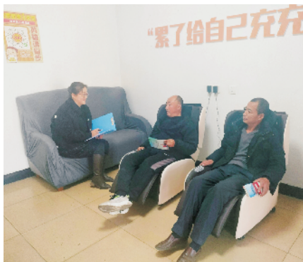
霍氏文化产业集团有限公司工会委员会卡车司机暖心驿站: