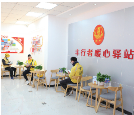
兴丰街道“丰行者”户外劳动者暖心驿站: