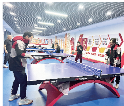
瀛海镇总工会党群中心公共区域职工之家: