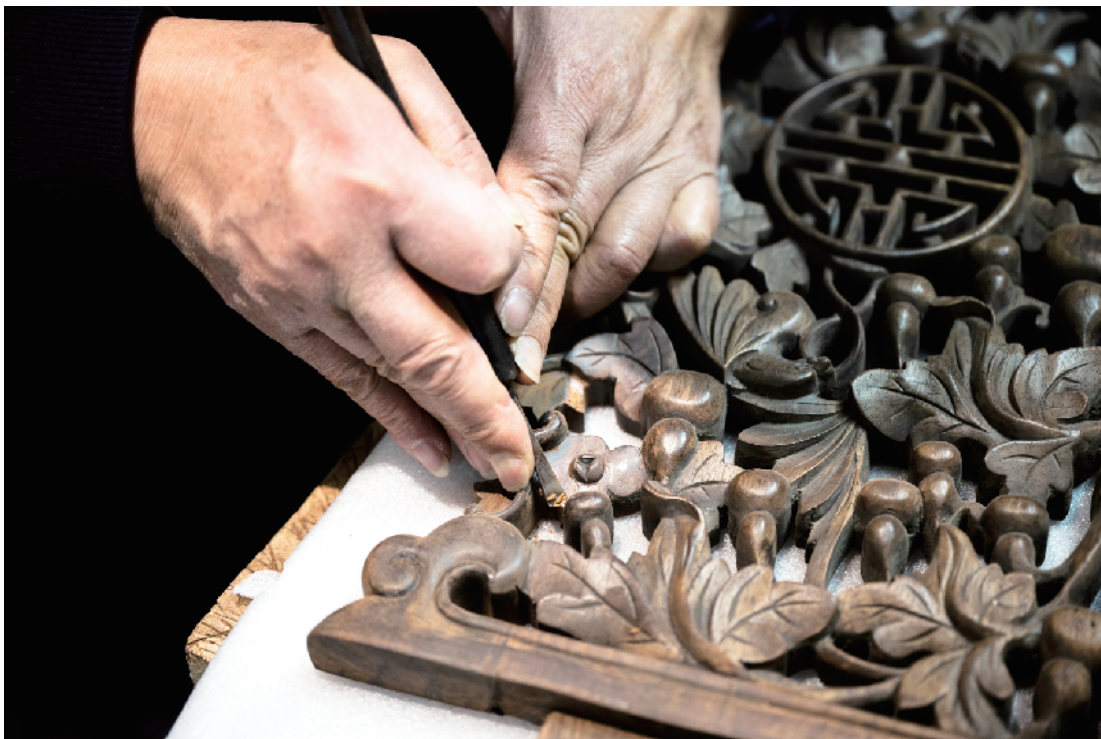
古旧家具残破的部分，依照原有的造型复原