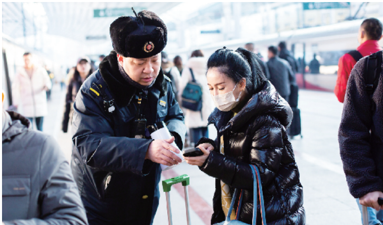
中国铁路北京局集团有限公司制定元旦旅客运输组织方案,全力保障运输

经排起了长队。“师傅,大概这个队伍还要排多久呀?”一名游客问向旁边维护秩序的工作人员。“大概还需要等50分钟。”工作人员回答道。作为熊猫界的大明星,萌兰的高人气吸引不少市民家长带着孩子趁着元旦假期来北京动物园一睹其风采。据北京市公园管理中心发布的消息,元旦假期三天,市属11家公园及中国园林博物馆共接待游客97.51万人次,同比增加91.99%,较2019年增加