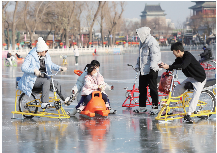
市民们在什刹海冰场享受冬日里的冰趣