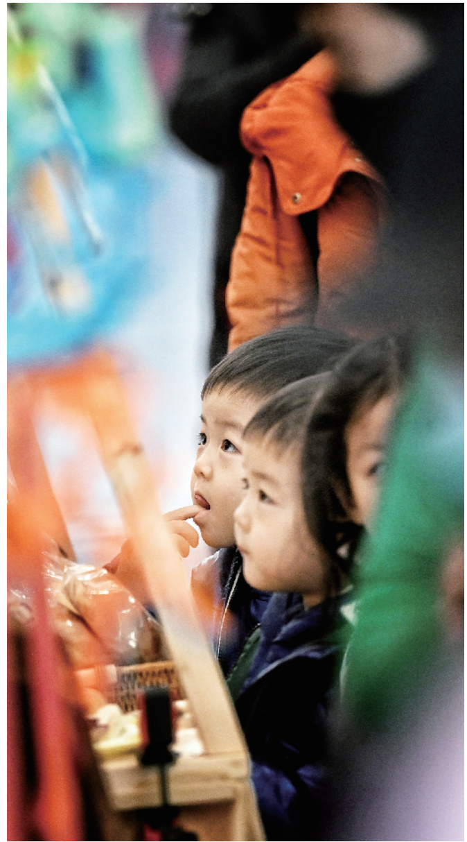
小朋友在西单大悦城体验民俗糖画的制作,感受节日氛围

回望身后远去的2023,奔向前方闪烁的2024,道不尽心中的美好憧憬,放飞新征程上的新希望。