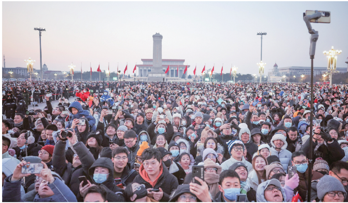
1月1日清晨,7.3万名群众齐聚天安门广场观看升旗仪式