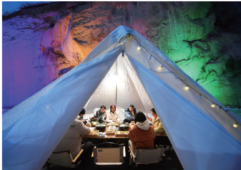
市民游客在延庆井庄体验冰上火锅