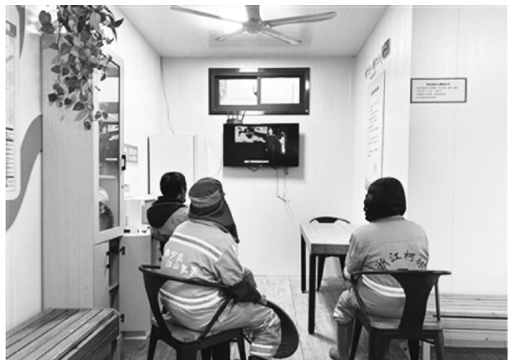
民群众也应爱护环境、尊重劳动，文明有礼对待户外劳动者，做到文明出行、文明用餐、文明旅游，让寒冬有暖意、更美好。 □徐曙光

相关部门和社会各界不妨多从细节入手，为户外劳动者送上冬日关怀，确保他们的身体健康。商家应自觉规范经营，不占道、守秩序，减轻环卫工人等户外劳动者工作量。广大市