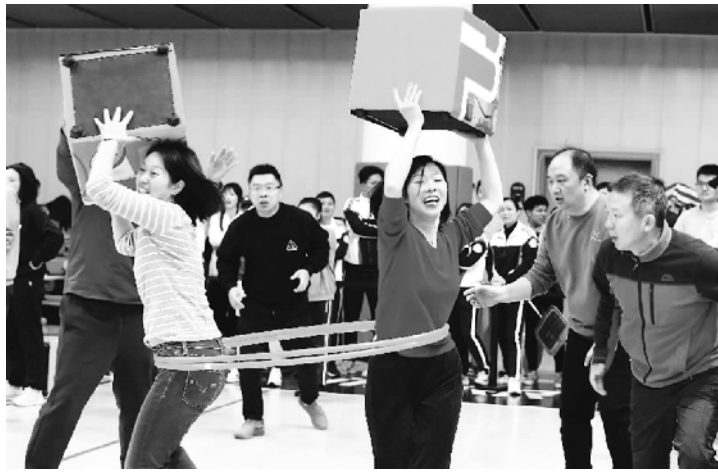
工会举办职工趣味运动会，不仅充实了职工文化建设，还有利于引导职工文体爱好者以良好的心态投身到企业各项生产工作中，不断增强企业凝聚力和向心力，助力职工为企业高质量发展贡献力量。

笔者以为，职工趣味运动会，以职工精神文化需求为导向，把职工喜闻乐见的各种兴趣活动与职工运动会的体育项目进行有机对接，进一步丰富了职工业余生活。从一定意义上来说，