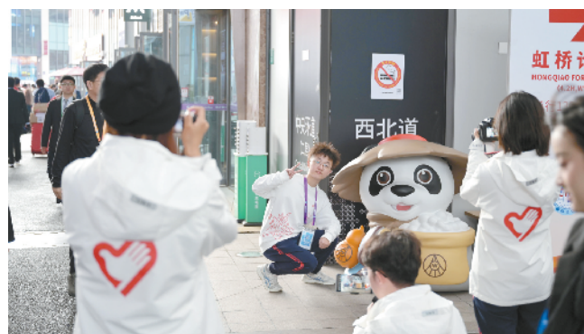
场馆内随处可见的吉祥物“进宝”吸引了志愿者留影留念