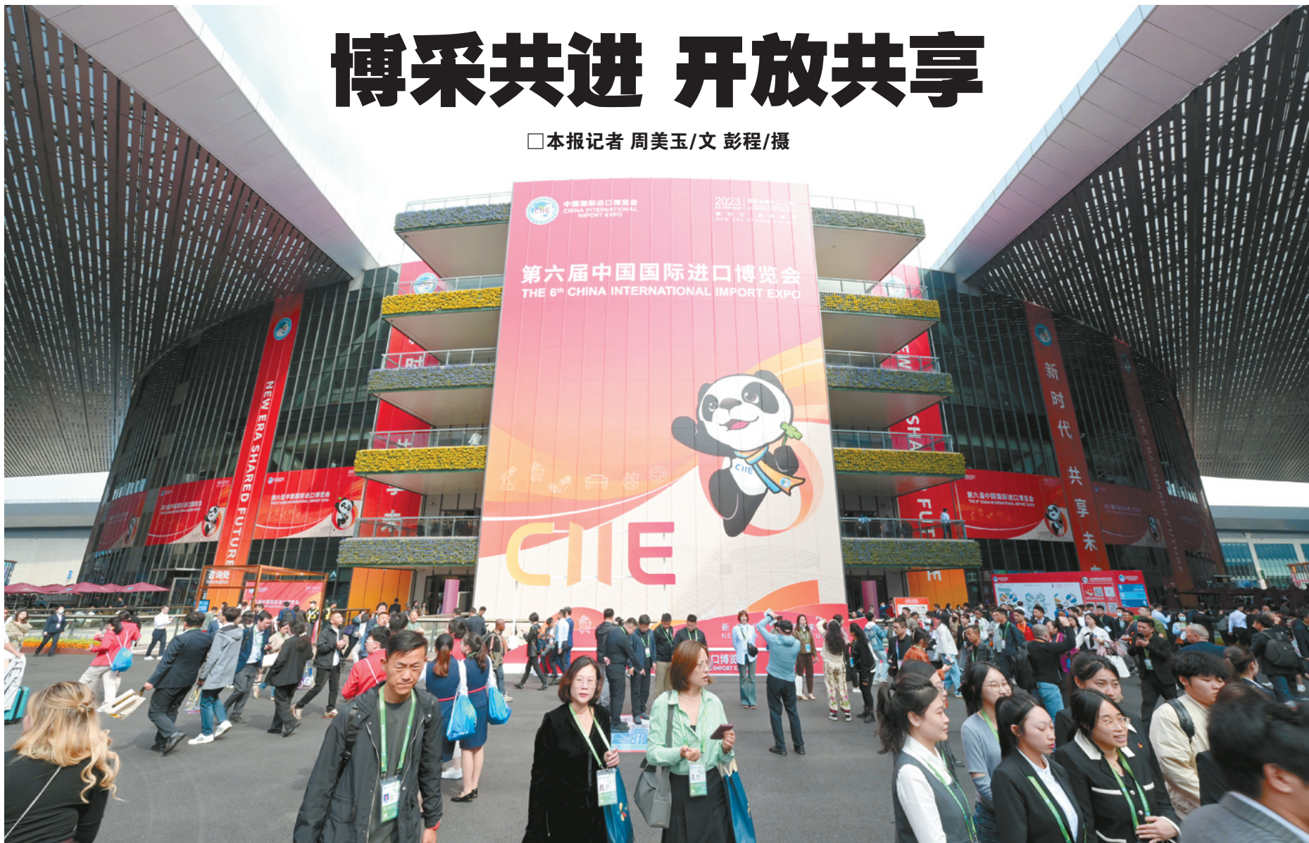
本届进博会有来自154个国家、地区和国际组织的来宾到场

“红”火现场展、“绿”色低碳风、炫酷“黑”科技……11月5日至10日，第六届中国国际进口博览会在上海举办。为期6天的进博会成为中外企业“秀”产品、亮技术、谈合作的大舞台，美食、家居产品、化妆品、先进的技术装备……来自全球的“好物”琳琅满目，令人目不暇接。