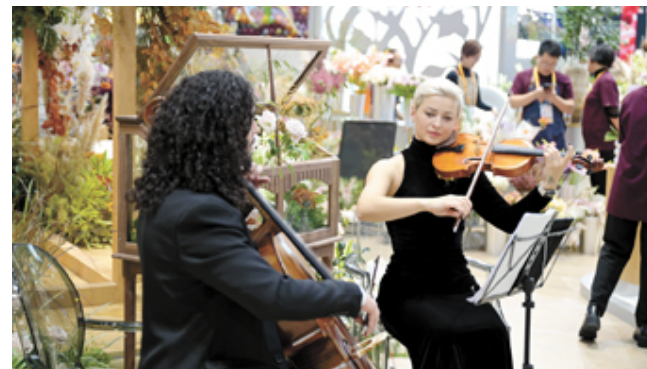
一号场馆内，在鲜花丛中演奏的外国演奏家吸引了不少观众