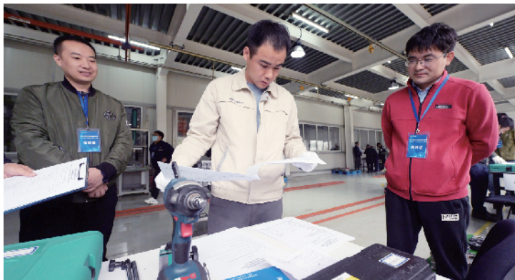
参赛选手认真阅读比赛流程规定