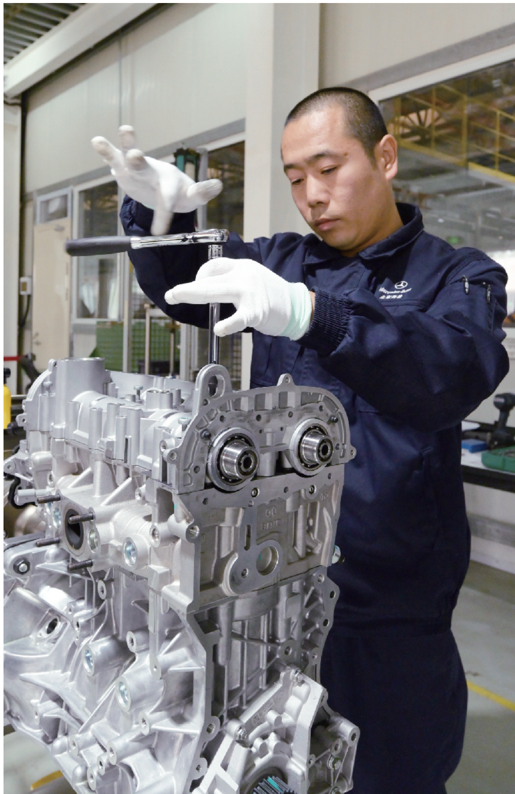
参赛选手逐一将零件安装到发动机上