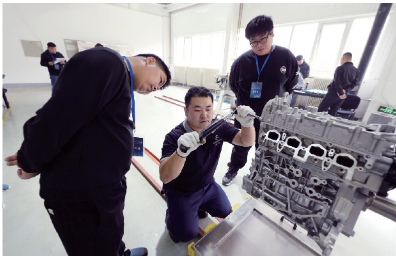
参赛选手动作娴熟，如同行云流水