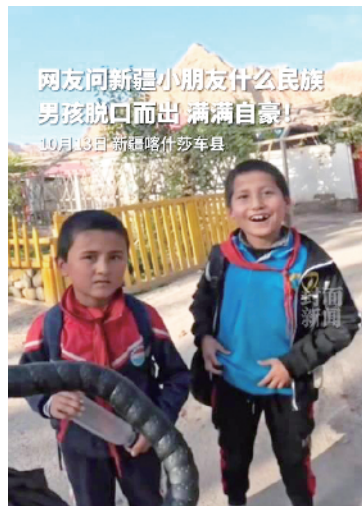
网友问新疆小朋友什么民族 男孩脱口而出 满满自豪！ 10月13日 新疆喀什莎车县

点评：相信每一个听到小男孩自信而响亮的回答，都会受感染，为祖国而骄傲，为我们的民族团结大家庭感到自豪。