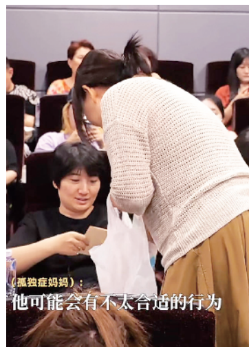
（孤独症妈妈）： 他可能会有不太合适的行为

点评：如今，越来越多的大学生选择返乡创业，成为新农人，他们头脑灵活，并能够熟练运用互联网等新技术，在农村希望的田野上，闯出一片海阔天空。