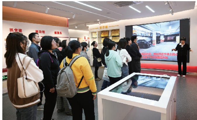
新入职工会干部到基层工会服务站参观学习