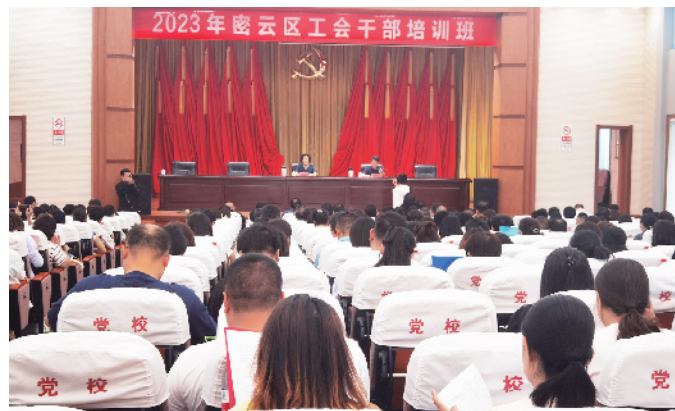
2023年密云区工会干部培训班开班仪式举行

工会事业守正创新、把握“竭诚服务职工群众”的工会基本职责和时代要求、理解正面情绪和负面情绪等主题进行专题辅导，对如何规范工会财务工作、依法依规使用与管理工会经费、帮助基层工会干部了解当前基层工会工作