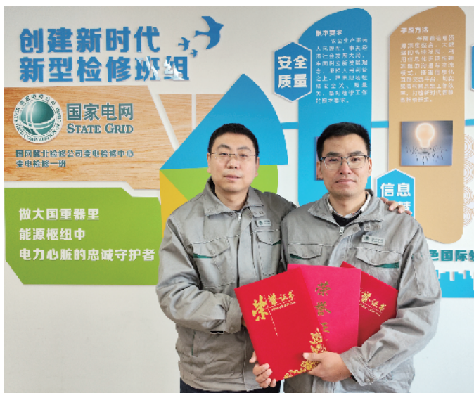
师徒齐心共创佳绩