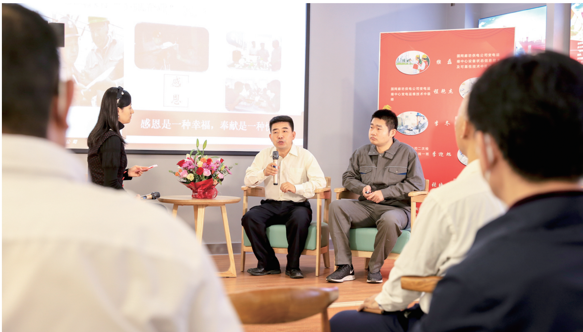
在拜师礼活动中分享师带徒经验