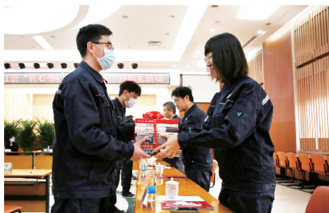
师傅向徒弟赠送业务书籍