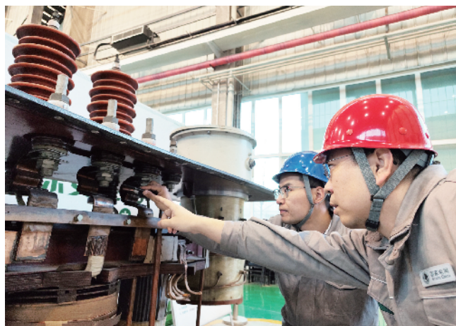
师傅为徒弟现场讲解变压器原理

像这样的名师带徒模式,已在国网冀北电力遍地开花。名师带徒活动深入基层,深入一线,在国网冀北电力服务清洁能源发展、服务京津冀经济社会发展过程中营造了浓厚的崇尚技术、苦学本领的学习氛围,在工作现场、在生产车间、在茶余饭后,总能看到师傅带着徒弟钻研技术的场景,一批新时代高素质技能人才正在名师带徒活动中快速成长。