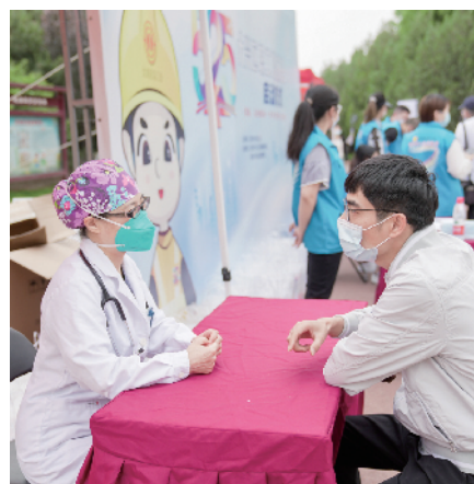
活动现场设有互动式心理健康讲座、免费义诊、宣传展板等

近日,新一年度“525”大兴区关爱职工健康系列活动全新开启。大兴区总工会将以“健康,从热爱每一个闪光的自己开始”为主题,开展一系列线上线下系列活动,群策群力,把职工健康作为重要任务,将“全方位、全周期保障职工健康”的承诺一贯到底,共建共享健康生活。