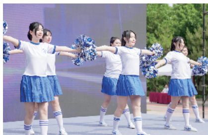
北京兴创投资有限公司职工表演自创自编的动感工间操