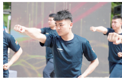
中军军弘保安服务有限公司的保安展示健体格斗拳

块阵地+两个中心+N次互动”为主线,通过“关”心,即心理健康、“爱”护,即维护权益、“自”防,即疾病预防、“我”能,即健康赋能等主题活动,在大兴微工会公众号上,按照“季季有亮点,全年不间断”的原则,广泛动员全区职工参与全年N次身心健康活动,推动宣传普及活动落到实处。