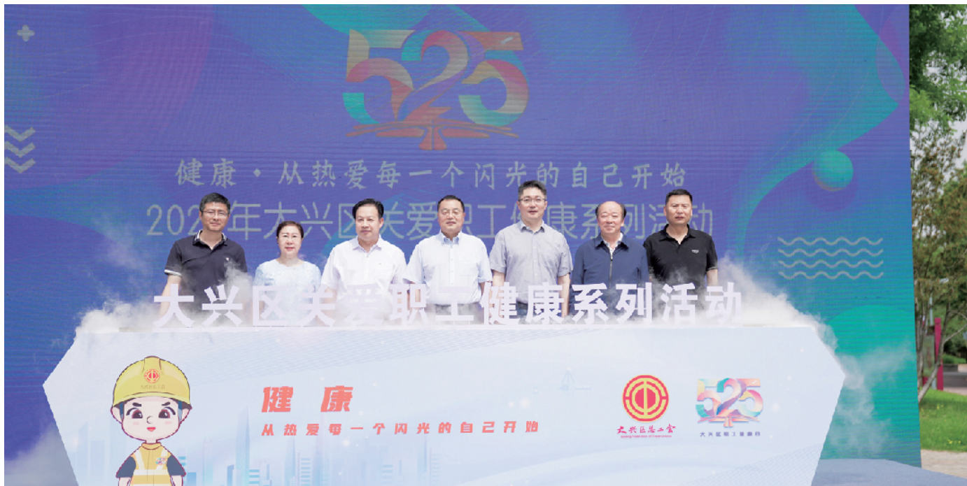
“525”大兴区关爱职工健康系列活动启动