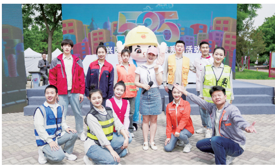
活动正式发布大兴区关爱职工健康主题曲《好好爱自己》

大兴区总工会相关负责人介绍,伴随着“525”大兴区关爱职工健康系列活动的启动,贯穿全年一系列线上线下活动将相继开展。全年线上宣传普及活动将以“一