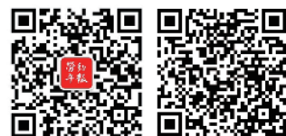
微信二维码 手机App二维码

□2023年5月13日星期六 □第440期 总第8247期 □癸卯年三月廿四 国内统一刊号：CN11—0221 邮发代号：1—376 网址：www.workerbj.cn