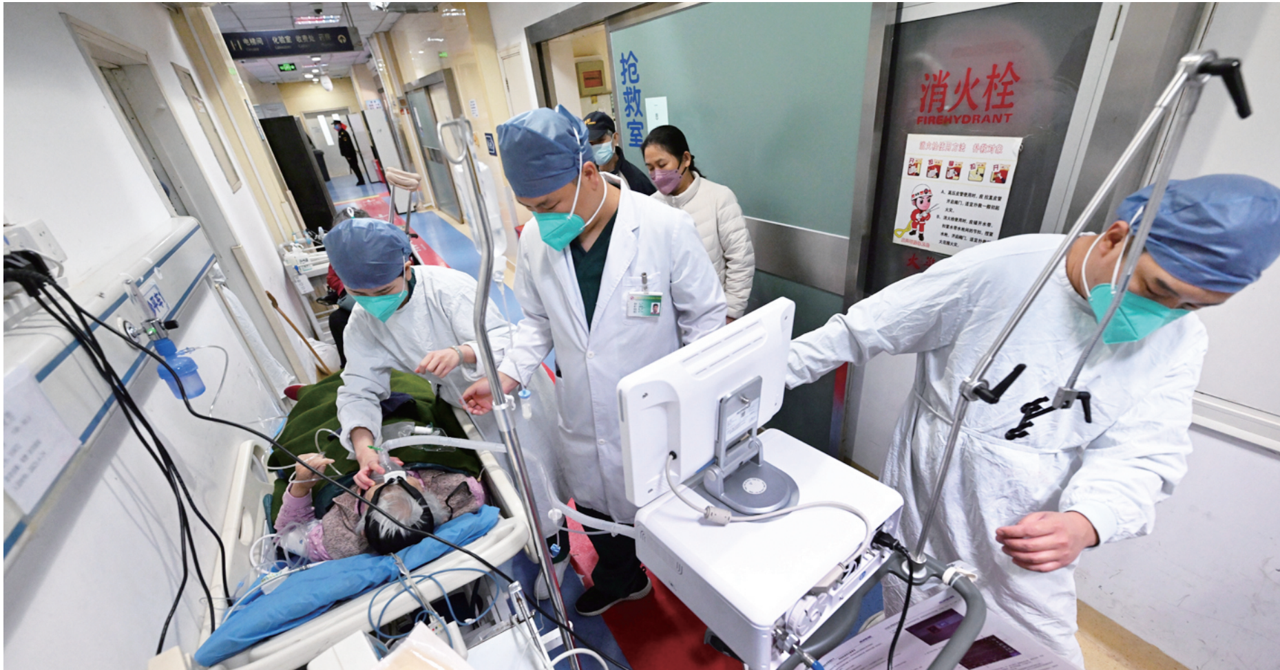
复兴医院急诊科的医务人员在争分夺秒地救治病人