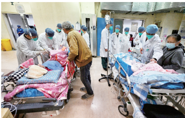
医务人员在急诊ICU查房