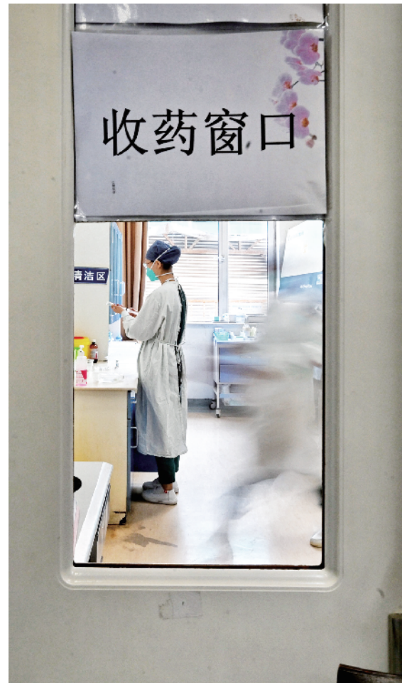
急诊输液室内，医务人员正在忙碌工作