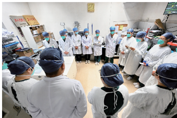
交接班时，医务人员会讲解病人的救治进展