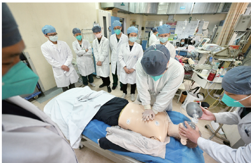
医务人员定期进行模拟救治演练

作为西城区区属医院，首都医科大学附属复兴医院不仅承担区域内日常急诊急救和突发事件的应急救治任