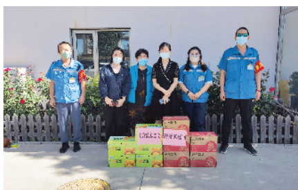
为辖区职工送清凉

经过不懈努力,截至目前,全镇已参保职工4523人次。越来越多的职工看到了职工互助保障活动给他们带来的实