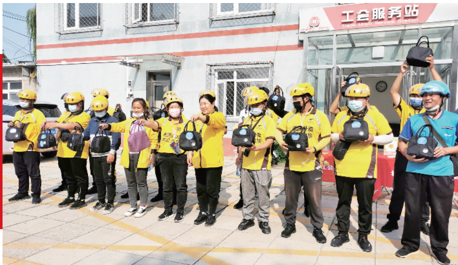
为外卖小哥发放清凉包

丰台区北宫镇总工会以党建引领为核心,以改革创新为动力,以服务好职工群众为己任,在思想引领、政策宣传、关心关爱、维权帮扶、丰富文体生活等方面,取得了明显成效,为辖区广大职工提供了贴心优质的服务。