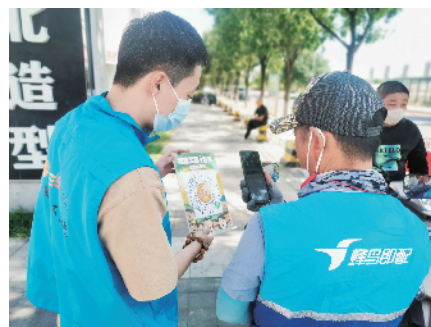
向新就业形态劳动者群体宣讲政策、指导入会