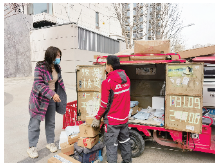
与快递小哥沟通了解情况