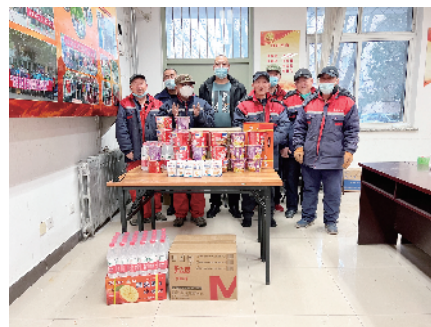
为春节留守岗位职工送温暖