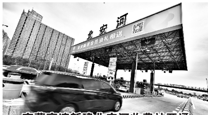
京藏高速新建北安河收费站开通

危旧楼房改建工作按照“一楼一策”组织实施。区政府授权确定实施主体后,实施主体会同项目所在街道(乡镇)、责任规划师组织开展摸底调查,征询居民意向,并委托专业设计单位编制规划设计方案和改建实施方案。规划设计方案、改建实施方案应报市老旧小区综合整治联席会议办公室备案。改建项目地上建筑规模增量原则上不超过30%,超过30%的,改建设计方案需经区政府审定后报市规自委会同市住建委审定;对于受规划条件限制,难以满足全部就地上楼条件的,结合腾退置换政策组织实施。