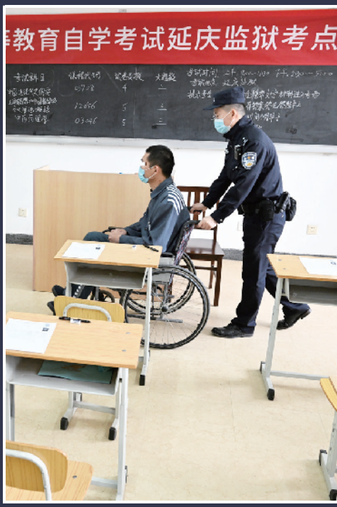
考试结束后，民警将“轮椅考生”推出考场