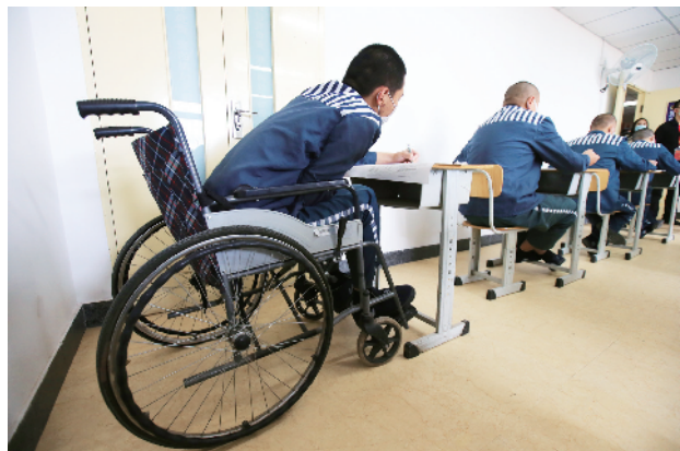
延庆监狱考场内一名服刑人员坐轮椅参加考试