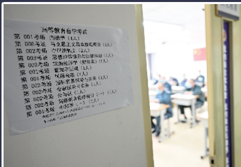
考场门口张贴着考场安排和考试科目